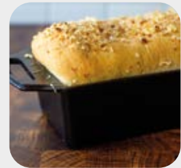
Teglia alta per pane