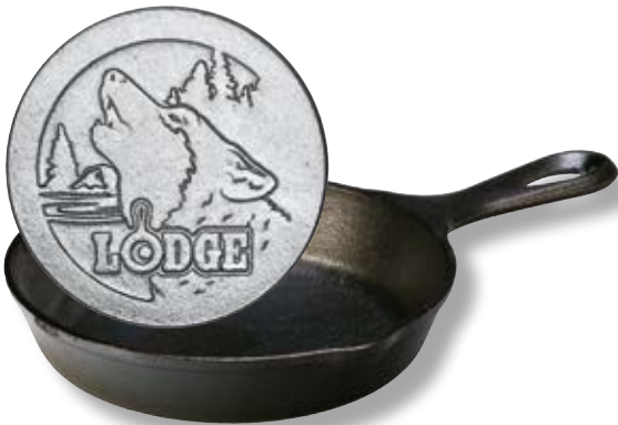
Padella Logo Lupo