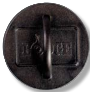
Pressa per grill tonda