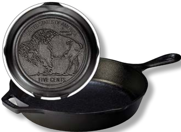
Padella Logo Bufalo

Outdoor - Wildlife Series è una collezione ispirata alla natura. Sul retro di ogni padella sono state disegnate dettagliate illustrazioni di animali selvatici.