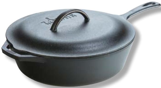
Pentola con coperchio