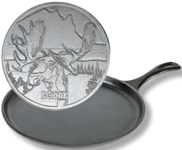
Bistecchiera Logo Alce