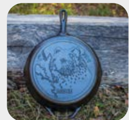
Padella alta Logo Tacchino