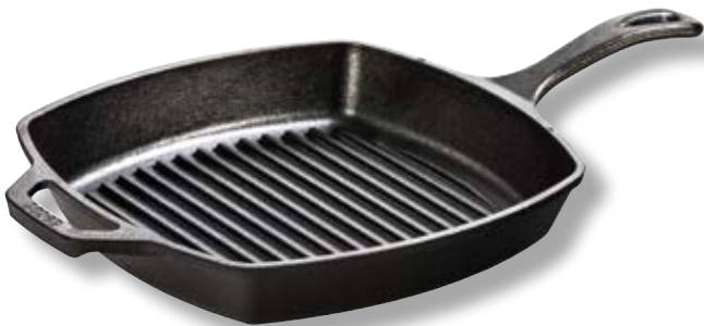
Bistecchiera rettangolare LDG L8SGP3