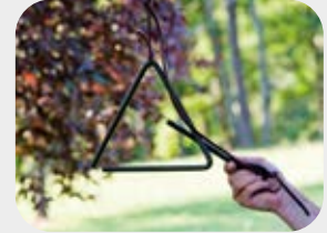
Cestello per friggere