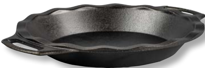
Teglia tonda per torte