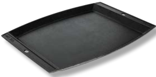
Piastra rettangolare LDG LSCP3