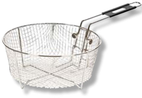
Cestello per friggere