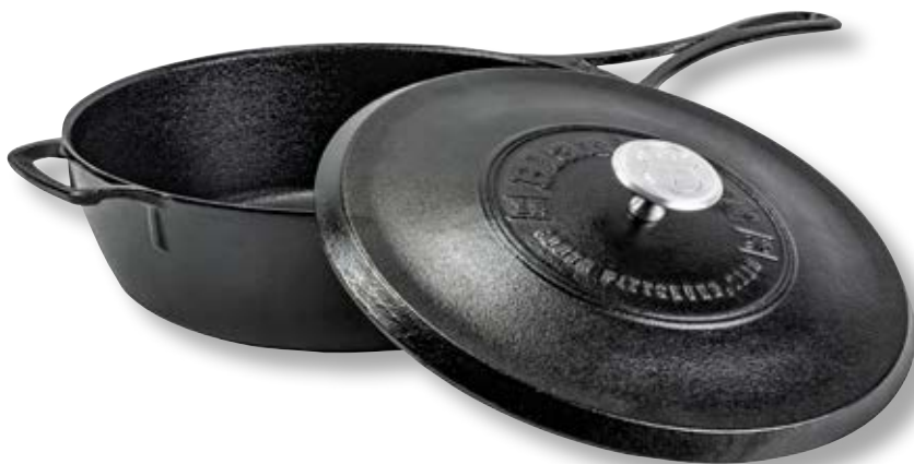
Tegame con coperchio Blacklock