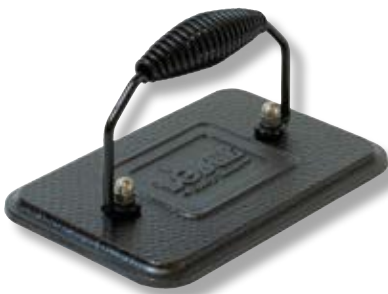
Pressa per grill rettangolare