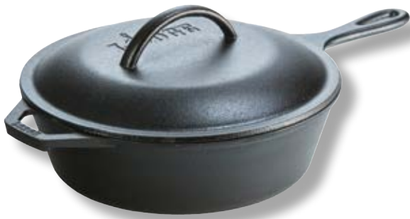
Pentola con coperchio