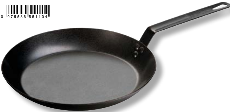
Padella in acciaio di carbonio