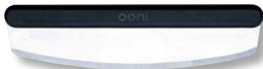
Mezzaluna tagliapizza OON UU-P06700