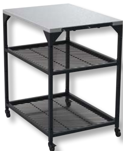
Tavolo modulare V2 medium OON UU-P2F000