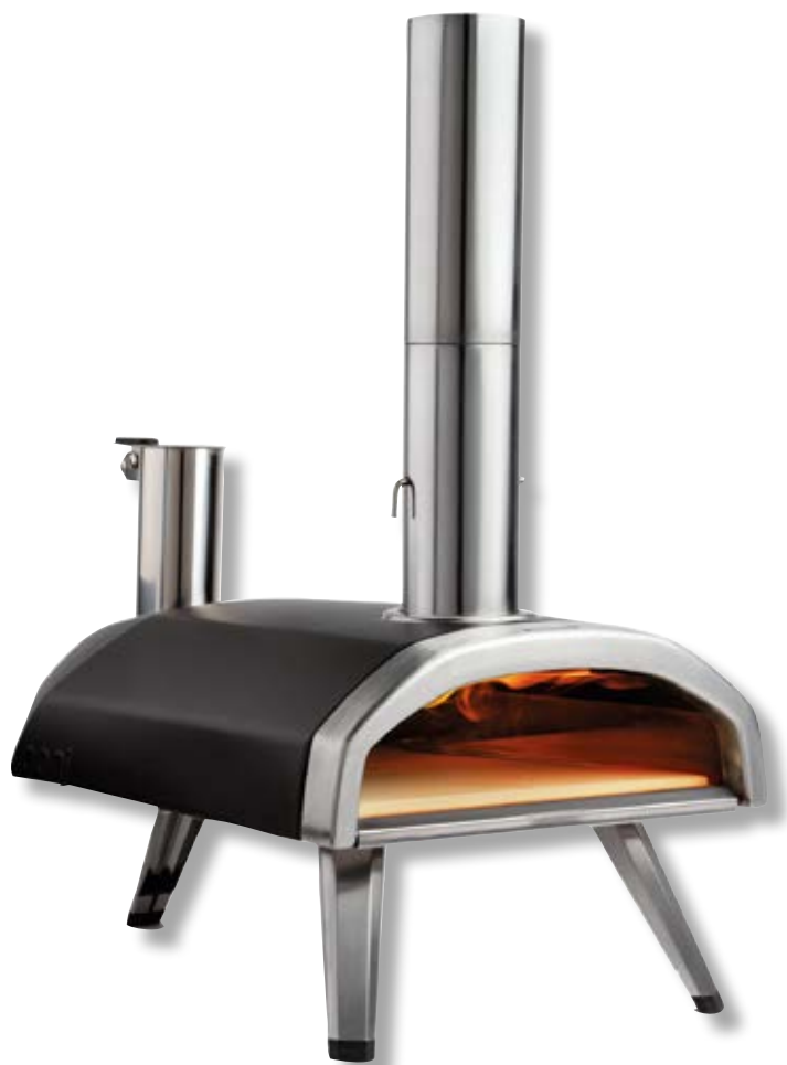
Ooni Fyra forno portatile a pellet di legno