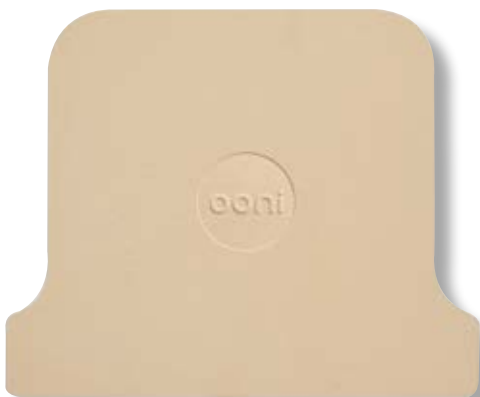
Pietra refrattaria OON UU-POB500