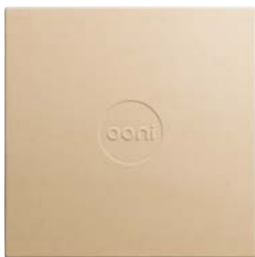
Pietra refrattaria OON UU-P25F00