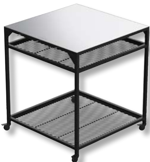
Tavolo modulare large OON UU-P0AC00