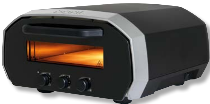
Ooni Volt 12 forno elettrico portatile