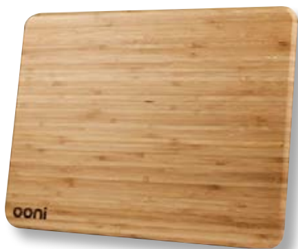
Tagliere OON UU-P24F00