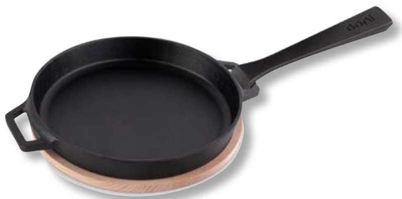
Padella in ghisa per Cottura