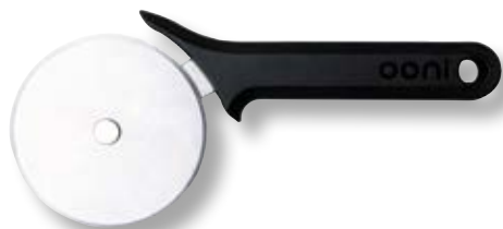
Ruota tagliapizza OON UU-P06600