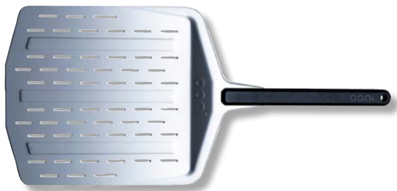
Pala forata in alluminio 35,5cm