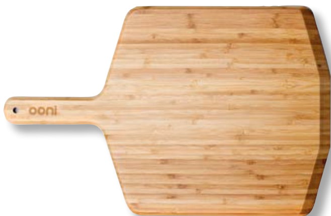
Pala in legno 35,5cm OON UU-P08300