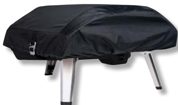
Copertura forno Koda 16