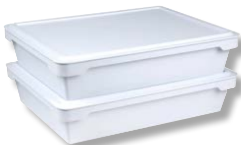
Set 2 contenitori sovrapponibili per impasto OON UU-P22800