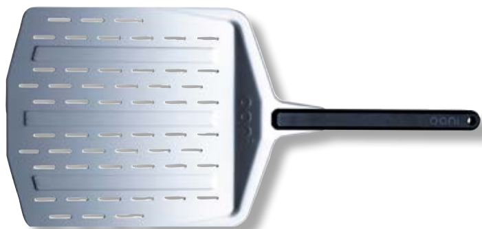
Pala forata in alluminio 30,5cm