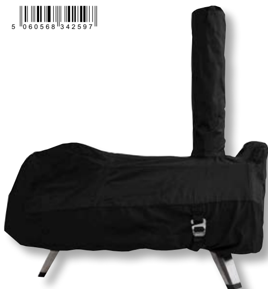
Copertura forno Karu 16 OON UU-POE500