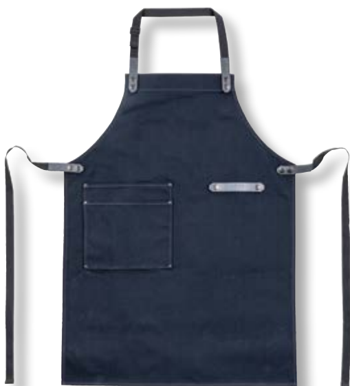
Grembiule da pizzaiolo OON UU-P09800