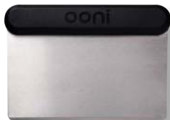
Raschietto per impasto OON UU-P09600