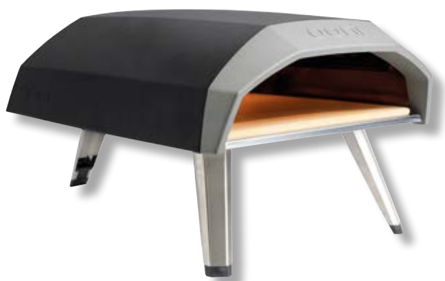
Ooni Koda forno portatile a gas