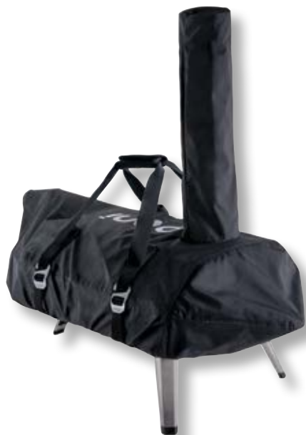
Copertura/Sacca trasporto forno Karu OON UU-P0A200