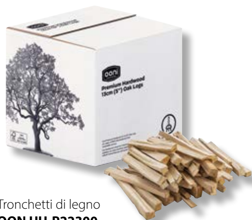
Tronchetti di legno