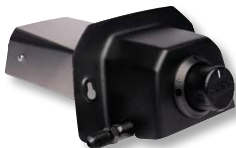
Bruciatore a gas forno Karu 2 Pro e Karu 16