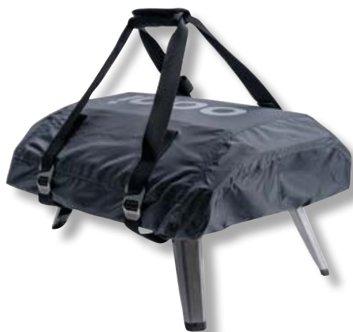
Copertura/Sacca trasporto forno Koda