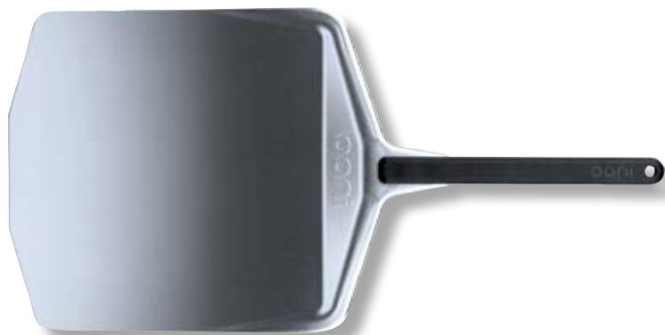
Pala in alluminio 35,5 cm