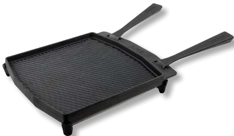
Bistecchiera in ghisa 2 manici