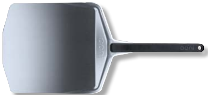
Pala in alluminio 30,5cm