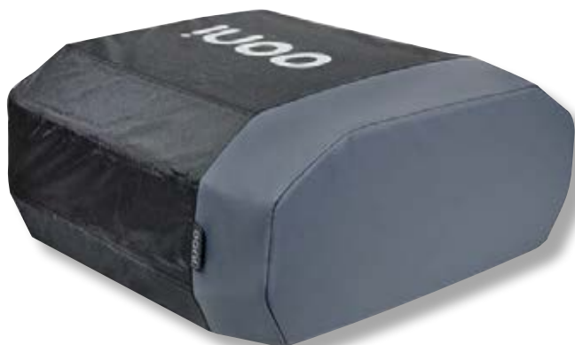
Copertura forno Volt 12