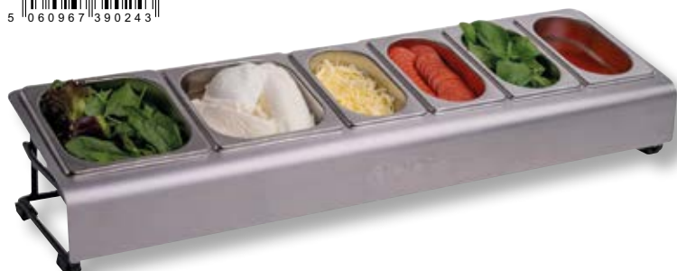
Pizza Topping Station OON UU-P0CE00