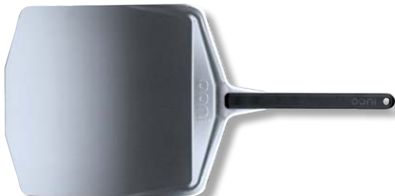
Pala in alluminio 40,5cm