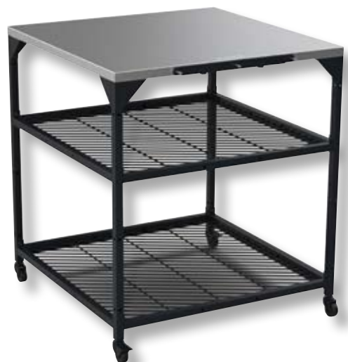
Tavolo modulare V2 large OON UU-P2F100