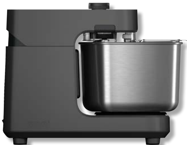
Halo Pro Spiral OON UU-P31500 • Colore: charcoal grey