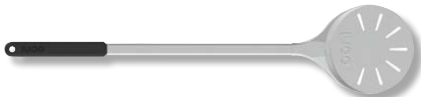
Pala in alluminio per girare la pizza