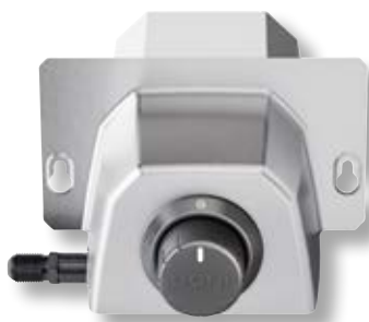
Bruciatore a gas forno Karu 12G