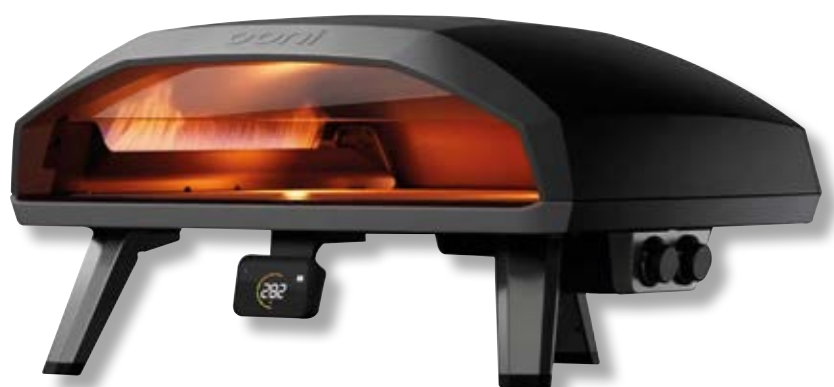
Forno a gas Koda 2 Max OON UU-P2B800