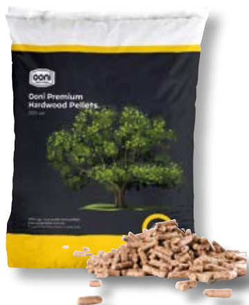
Pellet di legno massiccio (quercia)