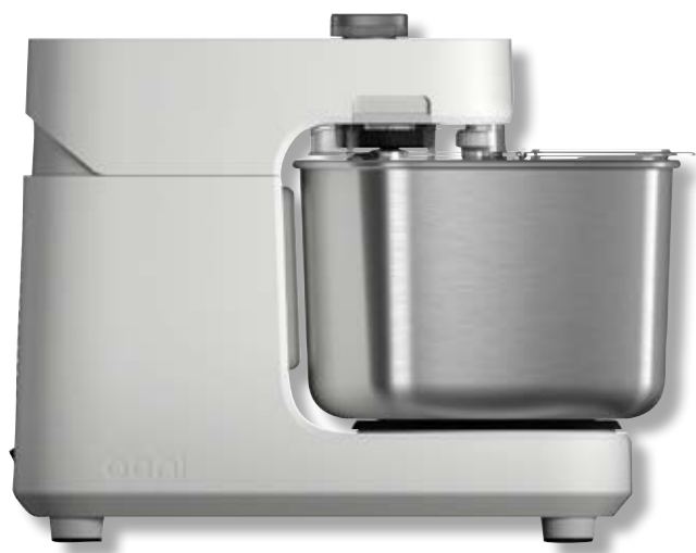
Impastatrice Halo Pro Spiral