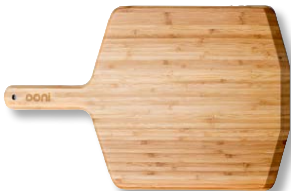
Pala in legno 30,5cm OON UU-P08200