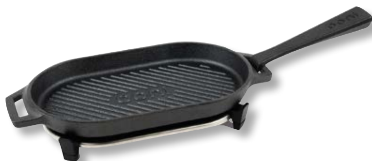
Bistecchiera in ghisa