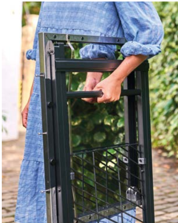
Tavolo pieghevole OON UU-P1F400

Tavolo pieghevole dotato di una superficie di lavoro in acciaio inossidabile di livello professionale, un telaio in acciaio al carbonio verniciato a polvere, un ripiano integrato e un portautensili con ganci. Facile da trasportare e riporre.