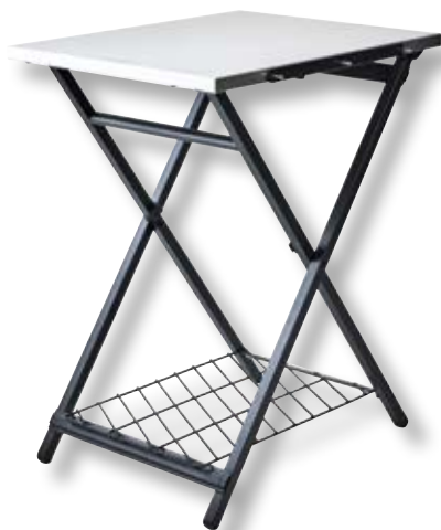
Tavolo pieghevole OON UU-P1F400