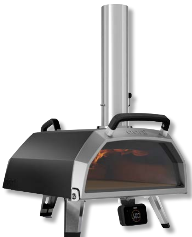
Ooni Karu 2 Pro forno portatile a legna o carbone vegetale o gas OON UU-P2EE00