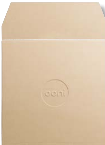
Pietra refrattaria OON UU-POE900