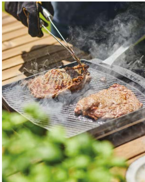
Bistecchiera in ghisa 2 manici