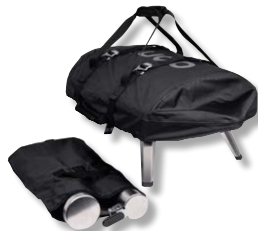
Copertura forno Fyra