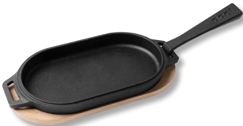
Padella in ghisa per Frittura