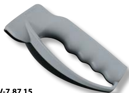
V-7.87 15 Affilalame con paramano.