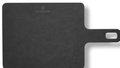
Tagliere cucina Handy Series