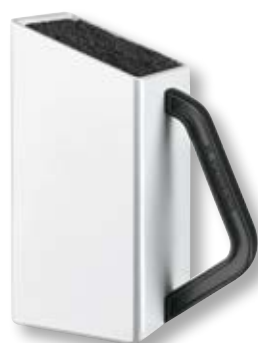
Ceppo Universal Small Bianco V-7.70 31.07