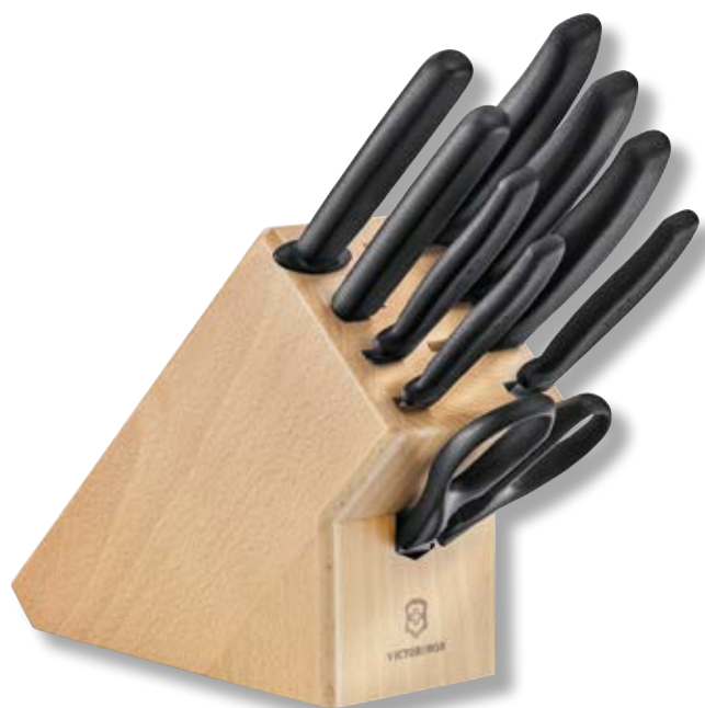
Ceppo Swiss Classic Extension V-6.71 93.9