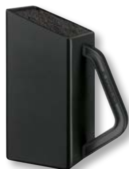
Ceppo Universal Small Nero V-7.70 31.03