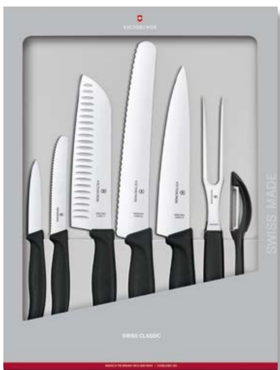
Coltelli Swiss Classic Set 7 pz