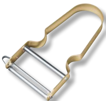
Pelaverdure Rex V-6.09 00.81 Colore: cashew