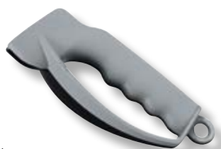
Sharpy V-7.87 14 Mini-affilalame con paramani.