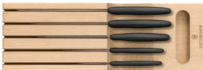
Ceppo Swiss Classic da cassetto V-6.71 43.5