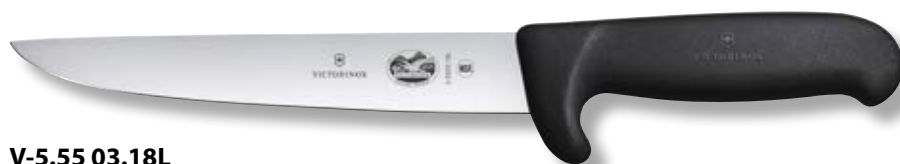
V-5.55 03.18L • Lunghezza lama: 18 cm