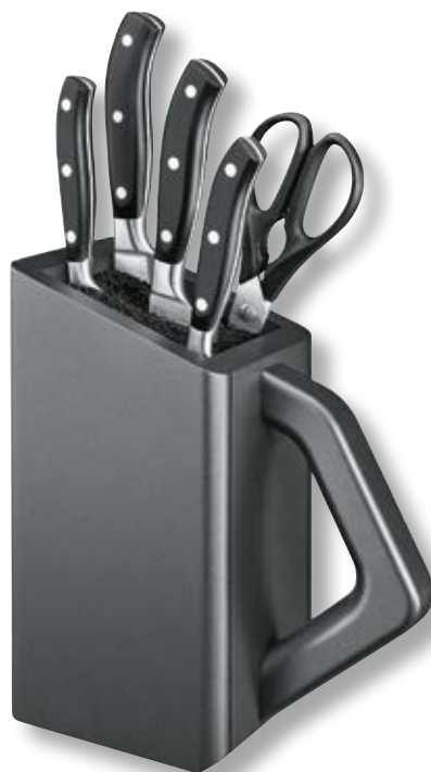
Ceppo Universal Grand Maître V-7.72 43.6