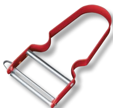
Pelaverdure Rex V-6.09 00.1 Lama dritta.