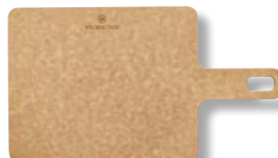
Tagliere cucina Handy Series