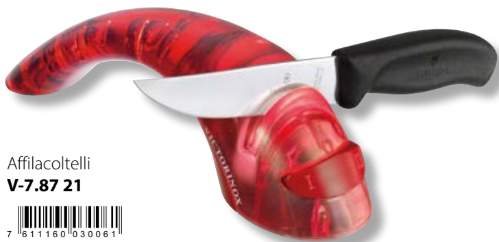
Affilacoltelli V-7.87 21