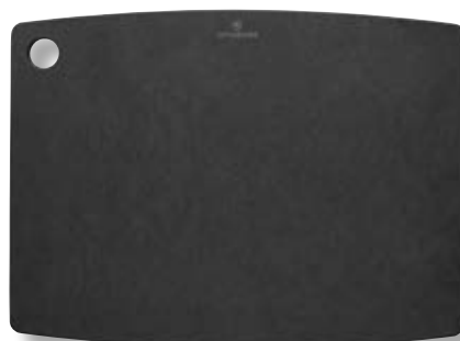
Tagliere cucina L