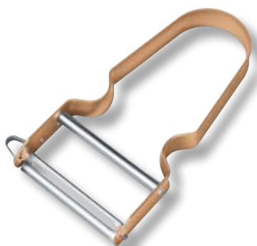
Pelaverdure Rex V-6.09 00.12 Colore: cinnamon