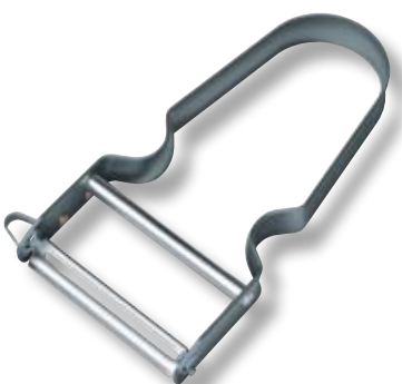
Pelaverdure Rex V-6.09 00.21 Colore: blueberry