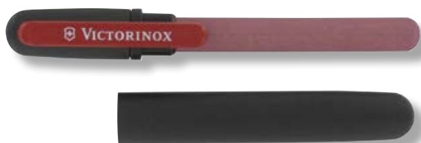
V-4.33 23 Affilalame doppio.