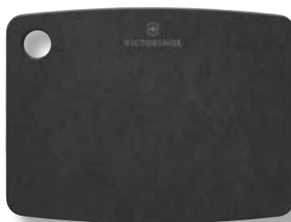
Tagliere cucina XS