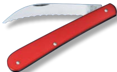
V-0.78 30.11 Coltello da panettiere.