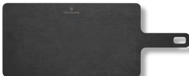
Tagliere cucina Handy Series