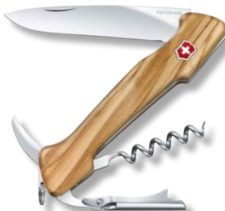
Wine Master Olivo V-0.97 01.64