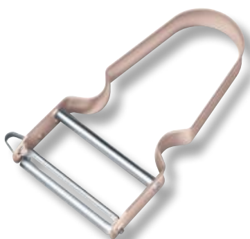
Pelaverdure Rex V-6.09 00.11 Colore: lavender