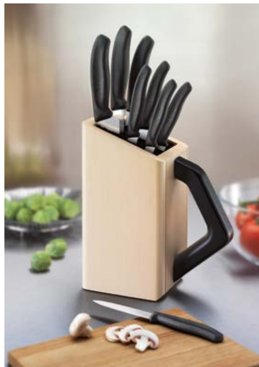
Ceppo Universal Swiss Classic V-6.71 73.8

Ceppo Universal con manici neri linea Swiss Classic.