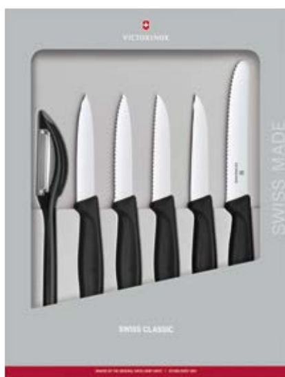
Accessori Swiss Classic Set 6 pz