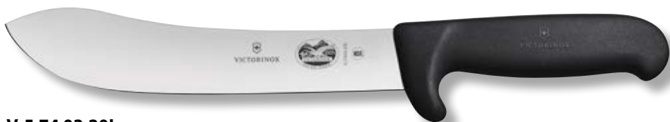
V-5.74 03.20L • Lunghezza lama: 20 cm

Nuova gamma di coltelli da macello Safety Grip e Safety Nose. Adatti a disossare e infilzare la carne, con nuova ergonomia del manico in Fibrox che garantisce, oltre all'assenza di contaminazione sui cibi, una presa ancora più sicura impedendo lo scivolamento.