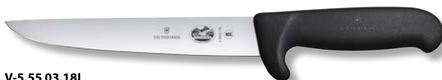
V-5.55 03.18L • Lunghezza lama: 18 cm