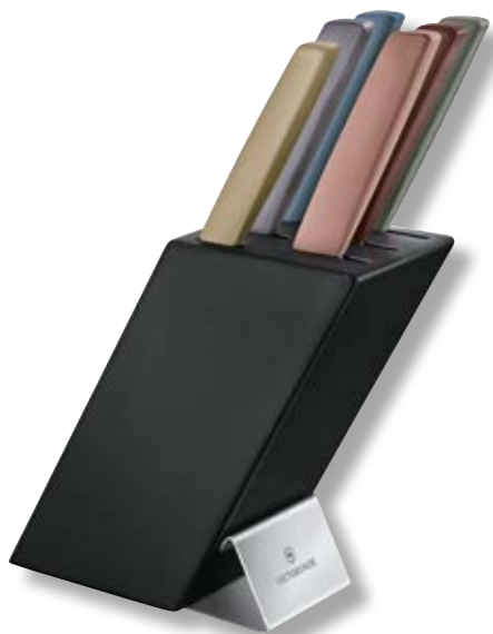
Ceppo Nero Swiss Modern V-6.71 86.66