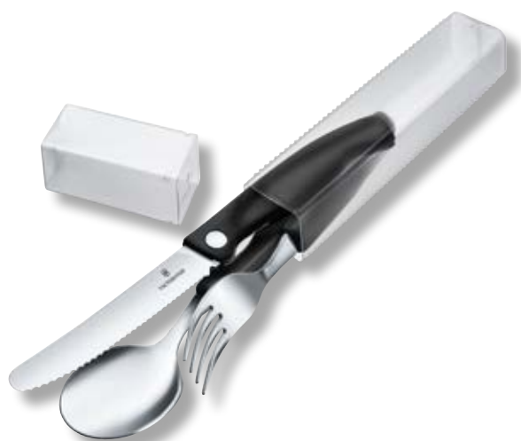
Swiss Classic set 3 posate