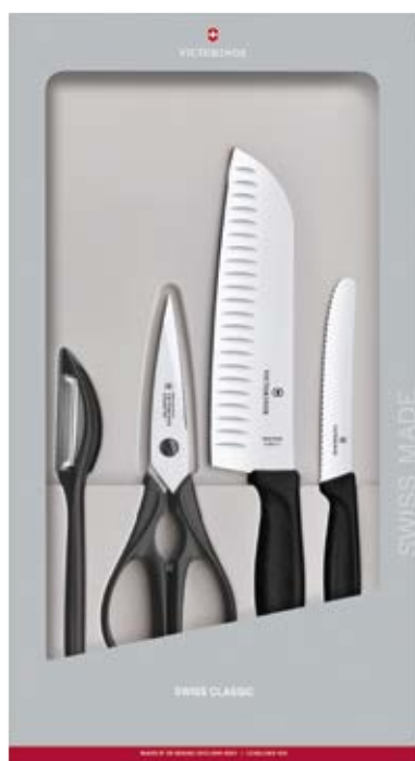
Accessori Swiss Classic Set 4 pz