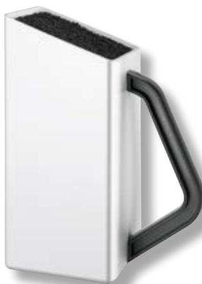
Ceppo Universal Medium Bianco V-7.70 33.07