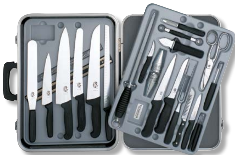
Valigia grande - Coltelli Swiss Classic V-5.49 23