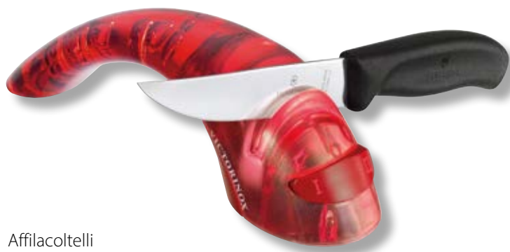
Affilacoltelli V-7.87 21