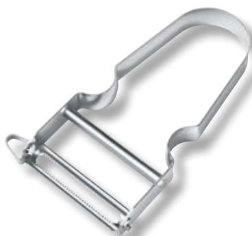
Pelaverdure Star V-6.09 13 Lama dentellata.