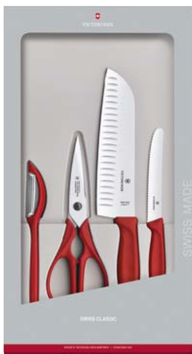
Accessori Swiss Classic Set 4 pz