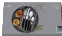
Confezione da 24 pz.