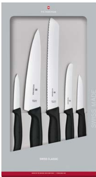
Coltelli Swiss Classic Set 5 pz