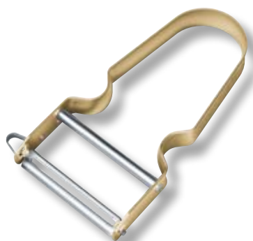
Pelaverdure Rex V-6.09 00.81