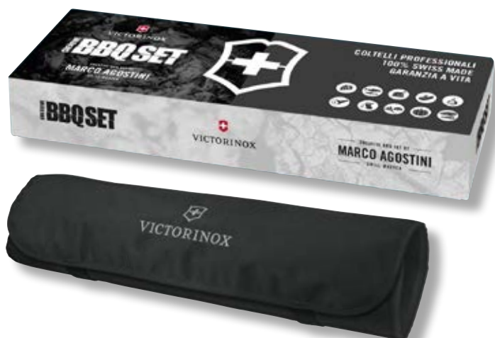
Creative BBQ Set by Marco Agostini V-5.BBQ 01