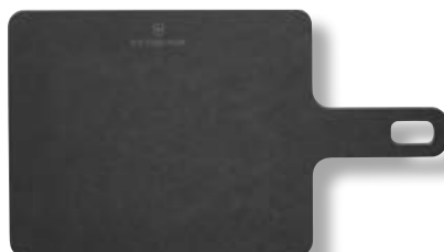
Tagliere cucina Handy Series V-7.41 31.3