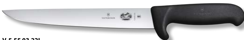
V-5.55 03.22L • Lunghezza lama: 22 cm