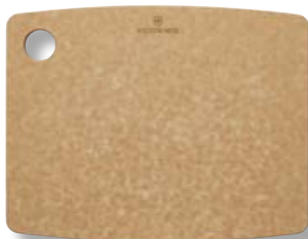
Tagliere cucina S