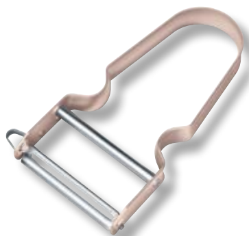
Pelaverdure Rex V-6.09 00.11