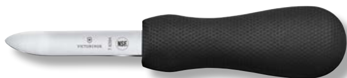
V-7.63 94 • Lunghezza lama: 7 cm