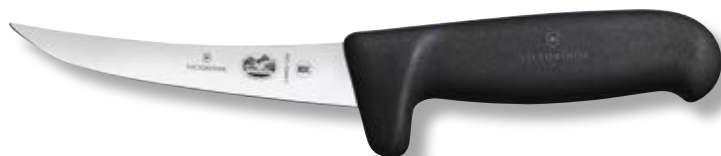
V-5.66 03.12M • Lunghezza lama: 12 cm