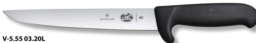
V-5.55 03.20L • Lunghezza lama: 20 cm