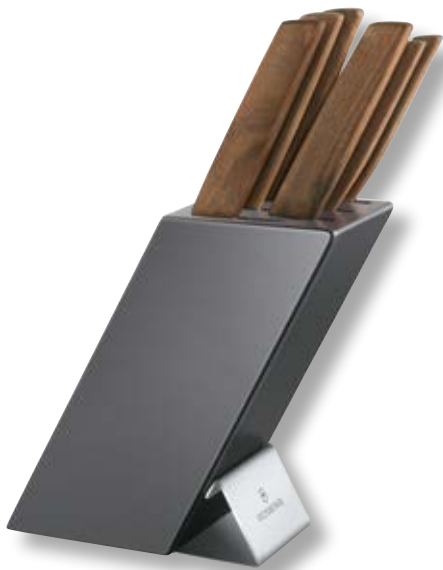
Ceppo Swiss Modern Wood V-6.71 86.6