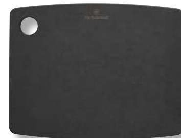
Tagliere cucina S