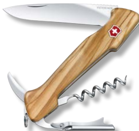
Wine Master Olivo V-0.97 01.64