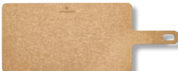
Tagliere cucina Handy Series V-7.41 32