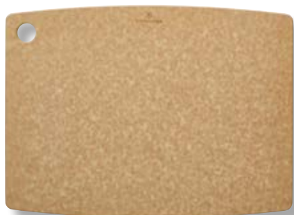
Tagliere cucina L V-7.41 23