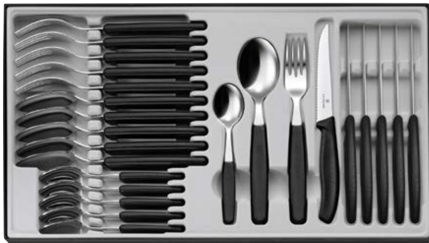
Scatola 24 posate