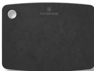
Tagliere cucina XS