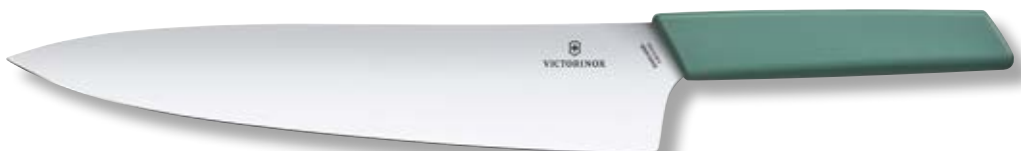
V-6.90 16.2543B • Lunghezza lama: 25 cm