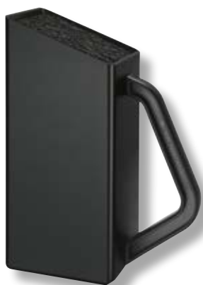
Ceppo Universal Medium Nero V-7.70 33.03