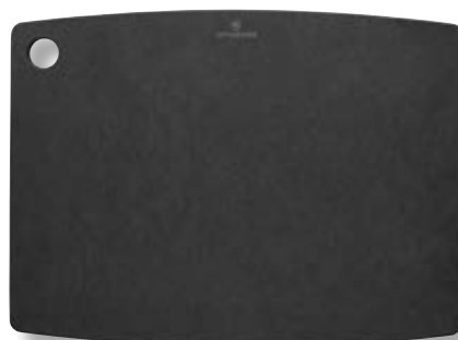
Tagliere cucina L V-7.41 23.3