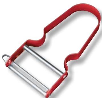
Pelaverdure Rex V-6.09 00.1 Lama dritta.