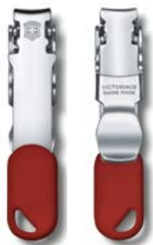
Nail Clipper V-8.20 50.10