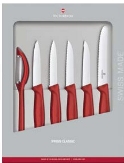
Accessori Swiss Classic Set 6 pz