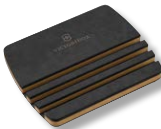
Base porta taglieri