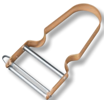
Pelaverdure Rex V-6.09 00.12