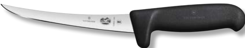
V-5.66 13.15M Lama flessibile. • Lunghezza lama: 15 cm