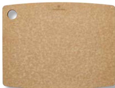
Tagliere cucina M