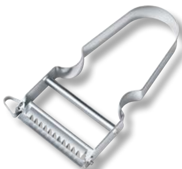
Pelaverdure Star V-6.09 14 Lama julienne.