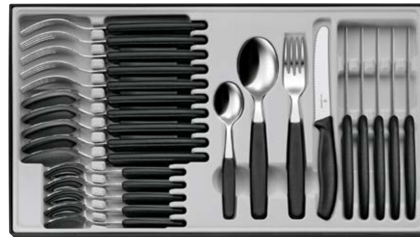
Scatola 24 posate