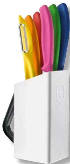
Ceppo Universal Small Bianco V-6.71 27.6L14