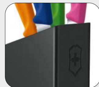
Ceppo Universal Small Bianco V-6.71 27.6L14

Ceppo vuoto portacoltelli o utensili dalla lunghezza di 12 cm con inserto in Polipropilene.