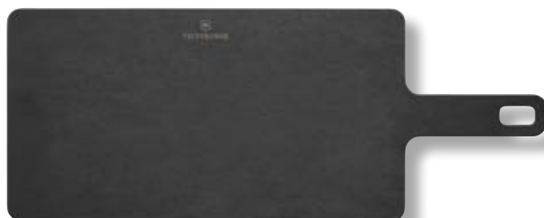
Tagliere cucina Handy Series V-7.41 32.3