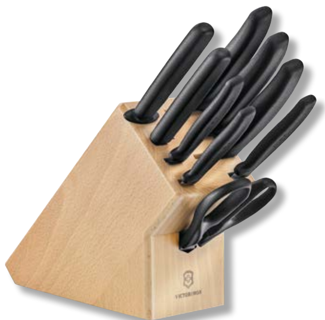
Ceppo Swiss Classic Extension V-6.71 93.9