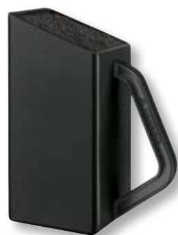
Ceppo Universal Small Nero V-7.70 31.03