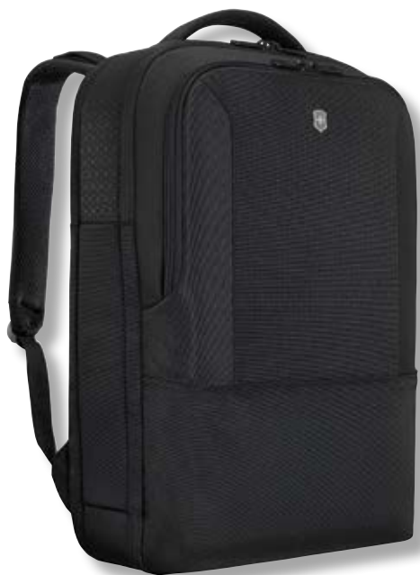
Zaino Portacoltelli V-5.49 53.0