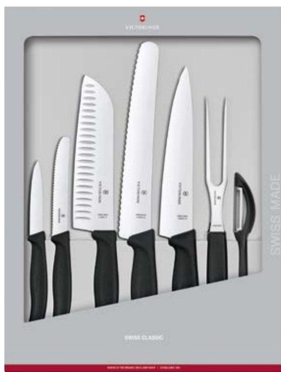
Coltelli Swiss Classic Set 7 pz