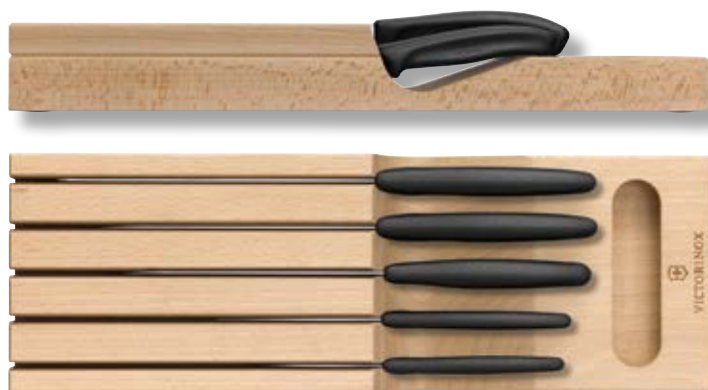
Ceppo Swiss Classic da cassetto V-6.71 43.5