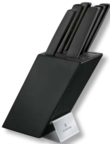
Ceppo Nero Swiss Modern V-6.71 86.63