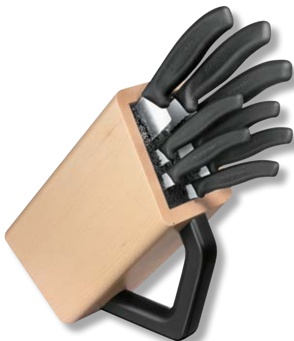
Ceppo Universal Swiss Classic V-6.71 73.8