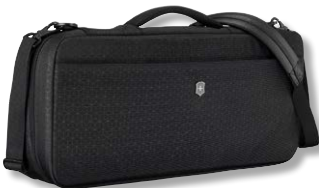
Borsa Portacoltelli V-5.49 63.0

borsa portacoltelli V-5.49 63.0 non inclusa