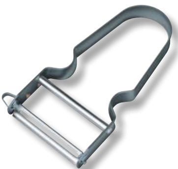
Pelaverdure Rex V-6.09 00.21