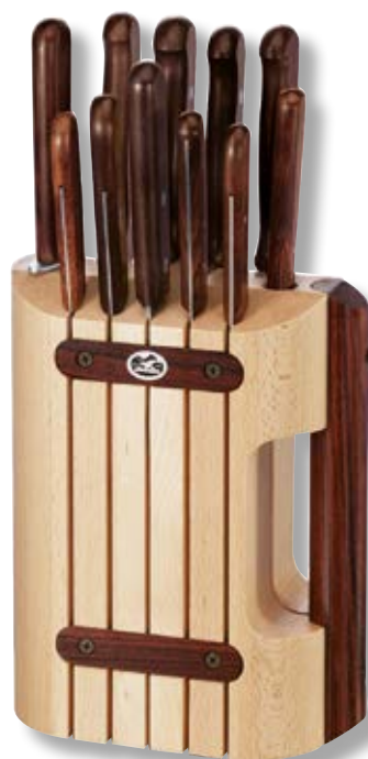
Ceppo - Coltelli faggio V-5.11 50.11