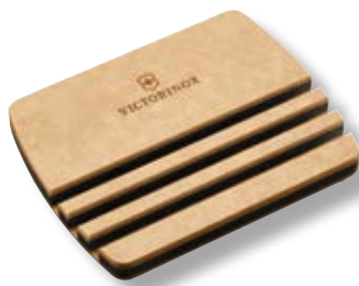
Base porta taglieri