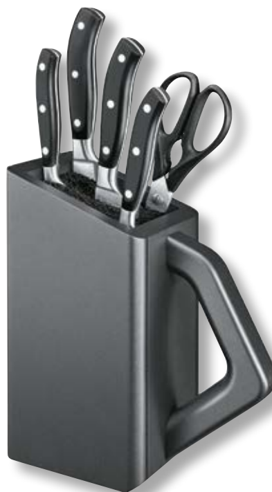
Ceppo Universal Grand Maître V-7.72 43.6