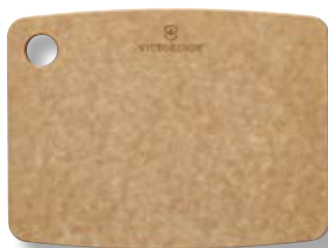
Tagliere cucina XS