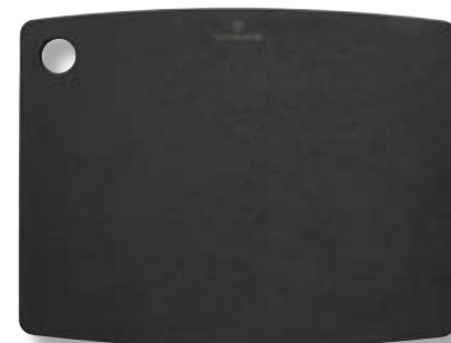
Tagliere cucina M