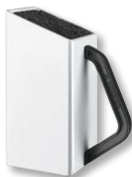
Ceppo Universal Small Bianco V-7.70 31.07