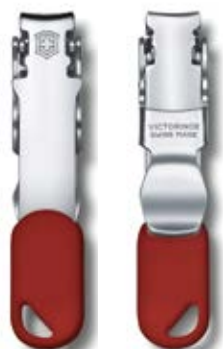
Nail Clipper V-8.20 50.10