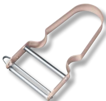
Pelaverdure Rex V-6.09 00.11 Colore: lavender