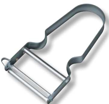
Pelaverdure Rex V-6.09 00.21 Colore: blueberry