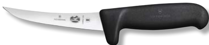
V-5.66 03.12M • Lunghezza lama: 12 cm