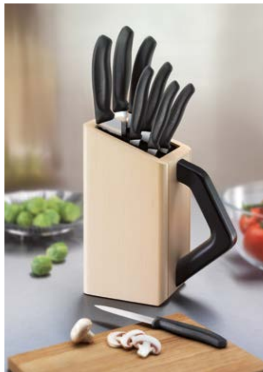
Ceppo Universal Swiss Classic V-6.71 73.8

Ceppo Universal con manici neri linea Swiss Classic.