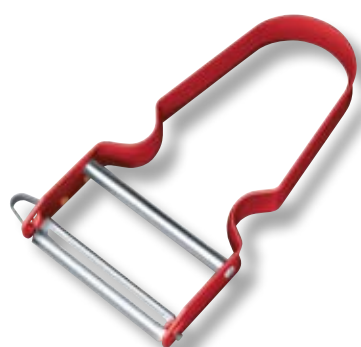
Pelaverdure Rex V-6.09 00.1 Lama dritta.