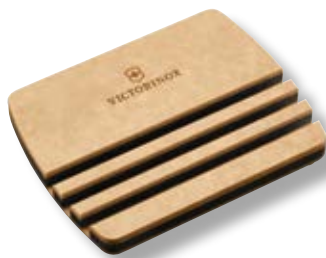
Base porta taglieri