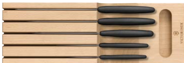
Ceppo Swiss Classic da cassetto V-6.71 43.5