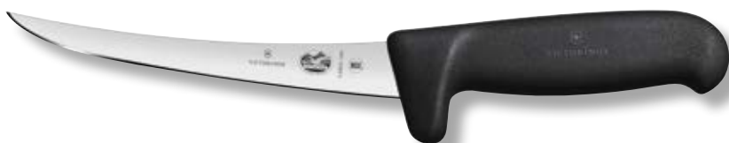
V-5.66 13.15M Lama flessibile. • Lunghezza lama: 15 cm