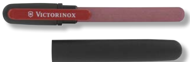
V-4.33 23 Affilalame doppio.