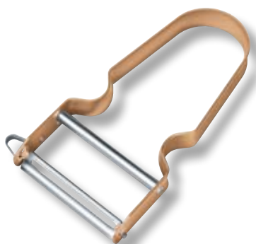
Pelaverdure Rex V-6.09 00.12 Colore: cinnamon