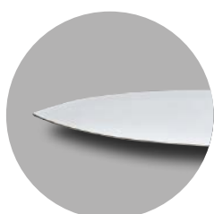
Lama liscia per tagli netti e precisi senza strappare