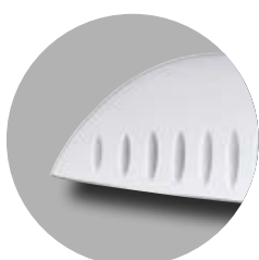
Lama liscia con alveoli permette di non far attaccare il cibo alla lama.