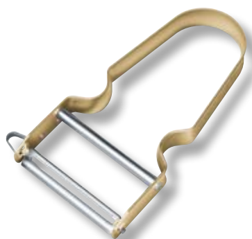
Pelaverdure Rex V-6.09 00.81 Colore: cashew