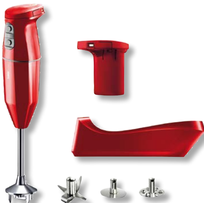
bamix® Cordless Plus