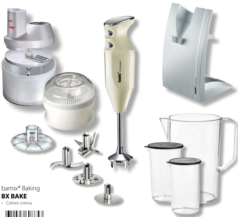
bamix® Baking BX BAKE