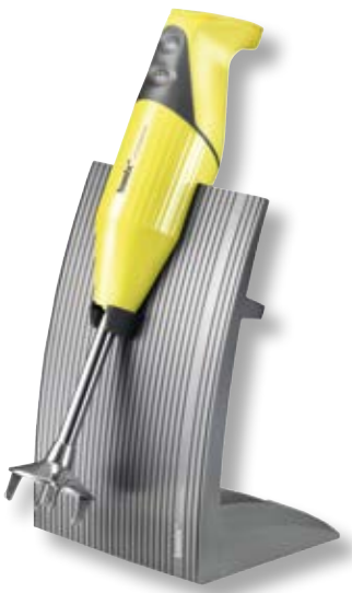
bamix® SwissLine Yellow BX SL YL