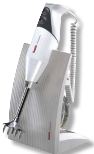
bamix® SwissLine White