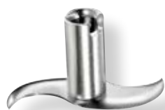
Lama per carne e verdura