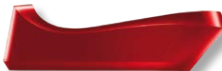
bamix® Cordless Plus