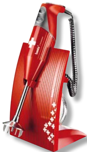
bamix® SwissLine Red