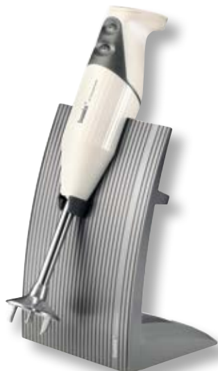
bamix® SwissLine Cream