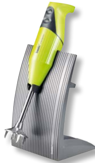
bamix® SwissLine Lime BX SL GR