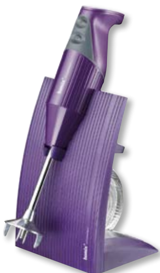
bamix Superbox BX SB PU