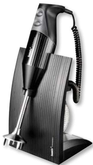
bamix Superbox BX SB BK