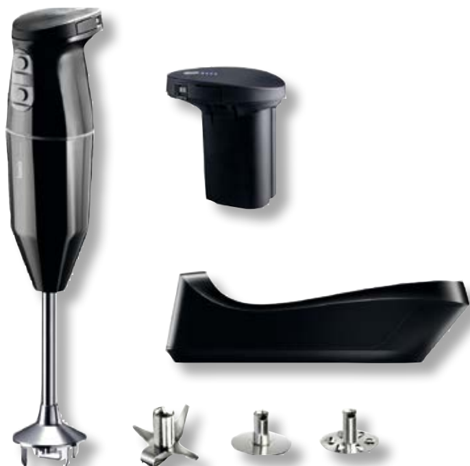
bamix® Cordless Plus