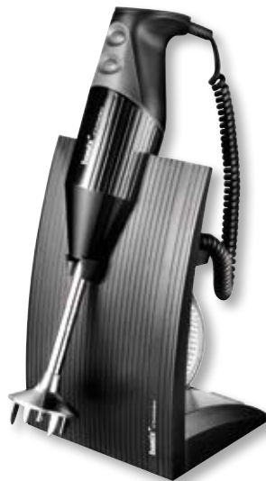
bamix® SwissLine Black