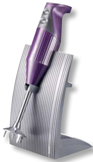
bamix® SwissLine Purple BX SL PU