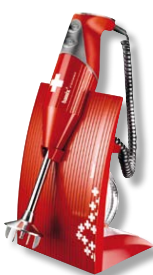
bamix Superbox BX SB RD