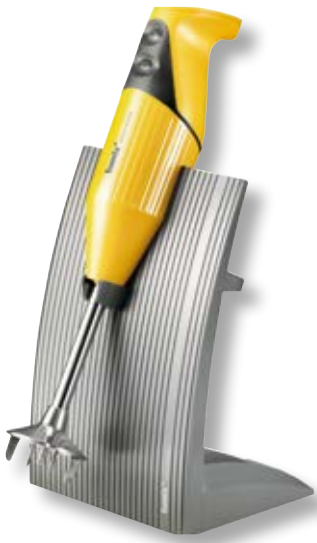
bamix® SwissLine Mango BX SL MA