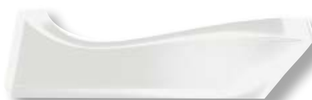
bamix® Cordless Plus