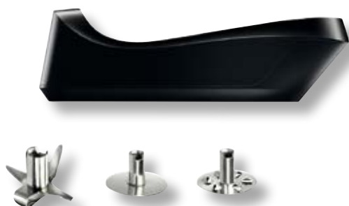
bamix® Cordless Plus