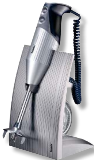
bamix® SwissLine Silver