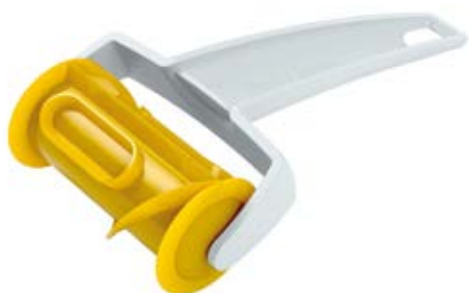
Croissant Roller BBS 155017.01