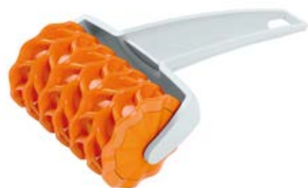
Grissini Roller BBS 155010.01