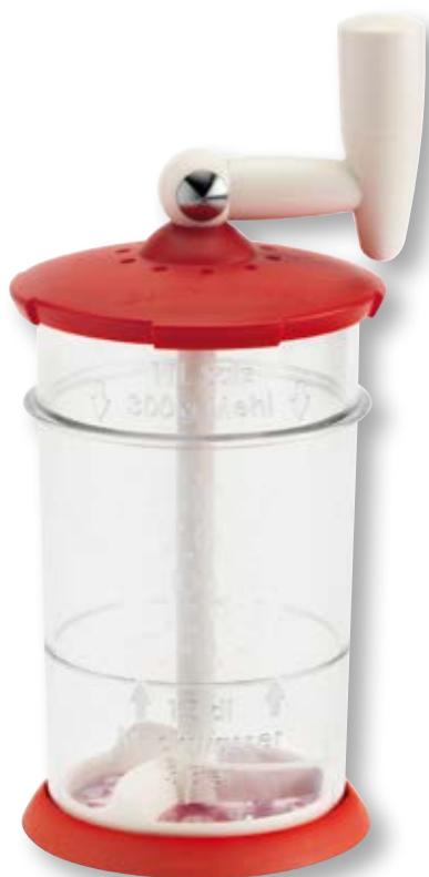
Spätzle Maker BBS 155004.01