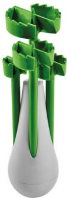
Veggie Drill BBS 155002.01