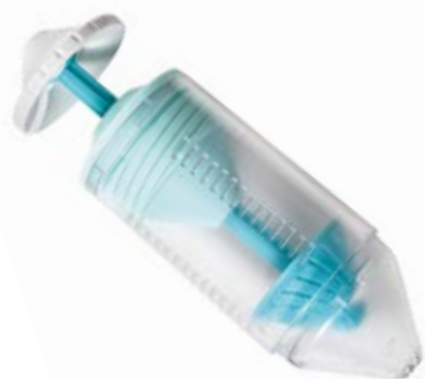
Deco Cream Whipper BBS 155019.01