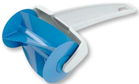
Pocket Roller BBS 155008.01