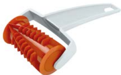
Christmas Roller BBS 155016.01