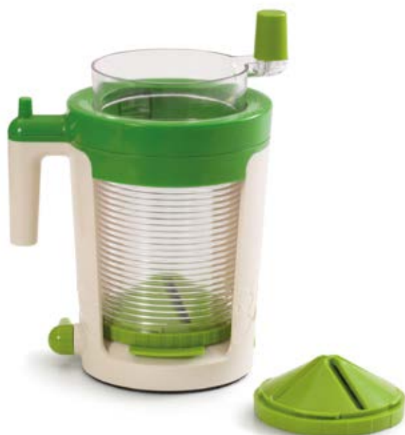
Maxi Spiralizer BBS 155001.01