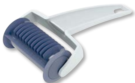
Stripes Roller BBS 155014.01