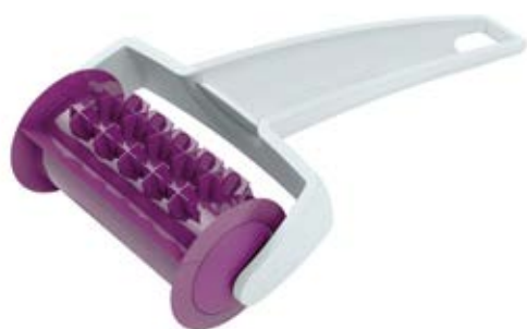
Star Roller BBS 155013.01