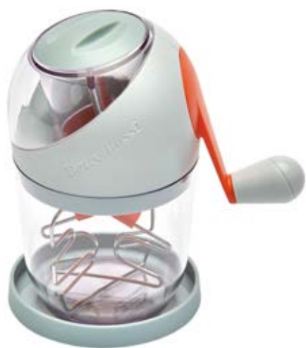
Sauce Maker BBS 155020.01