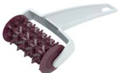
Cracker Roller BBS 155015.01