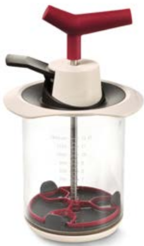
Batter Maker BBS 155007.01