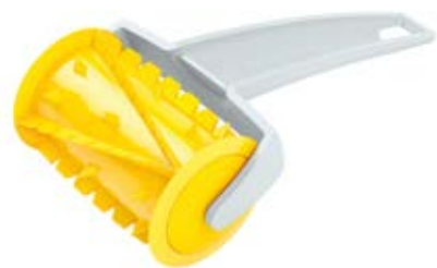
Nacho Roller BBS 155009.01