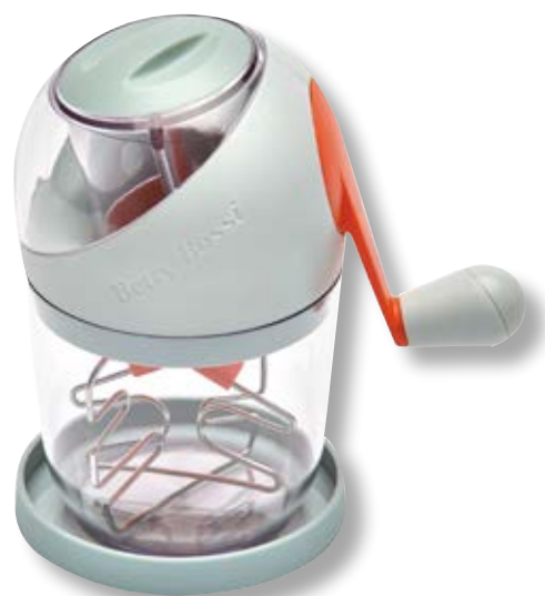
Sauce Maker BBS 155020.01