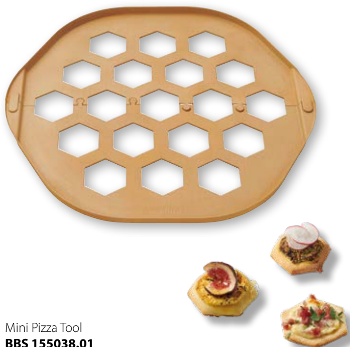
Mini Pizza Tool BBS 155038.01