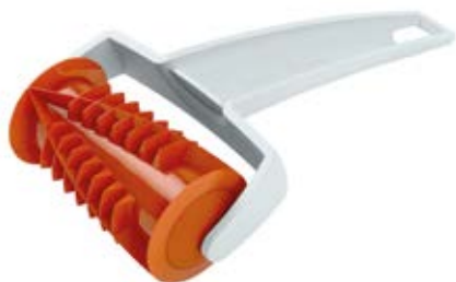
Christmas Roller BBS 155016.01