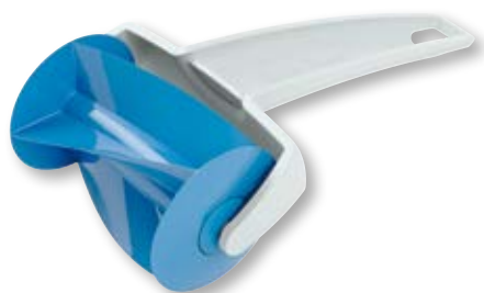
Pocket Roller BBS 155008.01