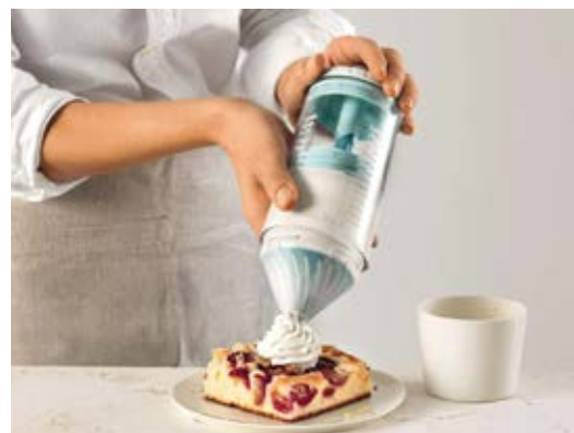
Deco Cream Whipper