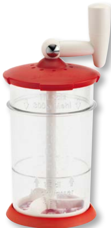
Spätzle Maker BBS 155004.01