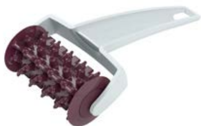
Cracker Roller BBS 155015.01