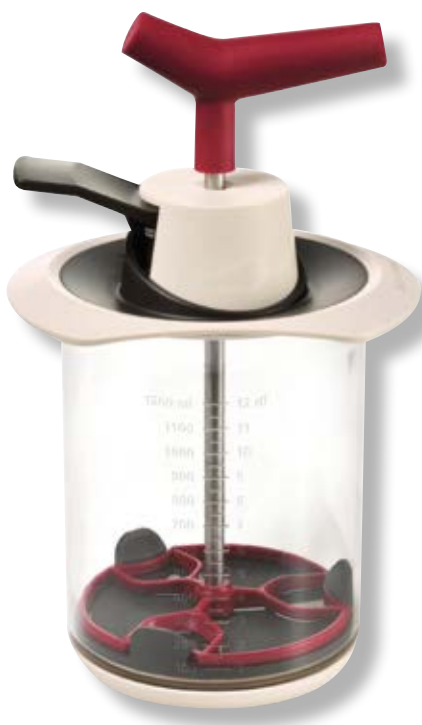
Batter Maker BBS 155007.01