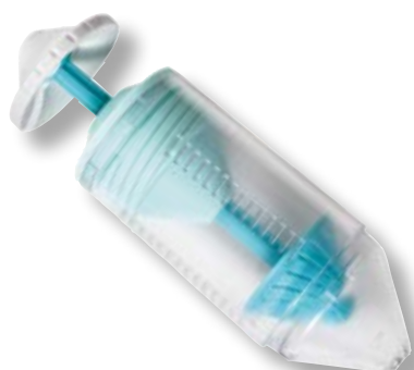
Deco Cream Whipper