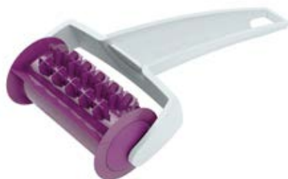
Star Roller BBS 155013.01