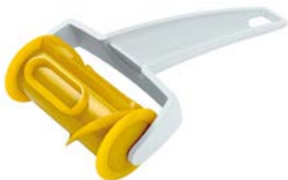
Croissant Roller BBS 155017.01