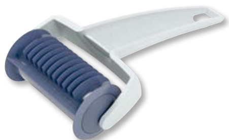
Stripes Roller BBS 155014.01