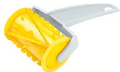
Nacho Roller BBS 155009.01