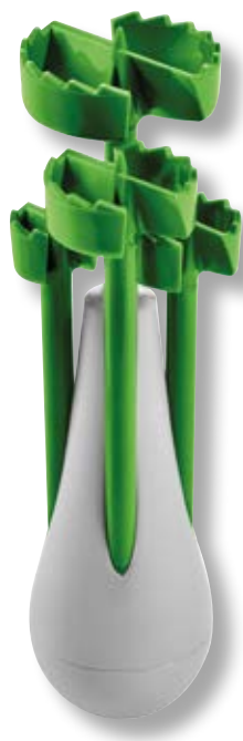
Veggie Drill BBS 155002.01