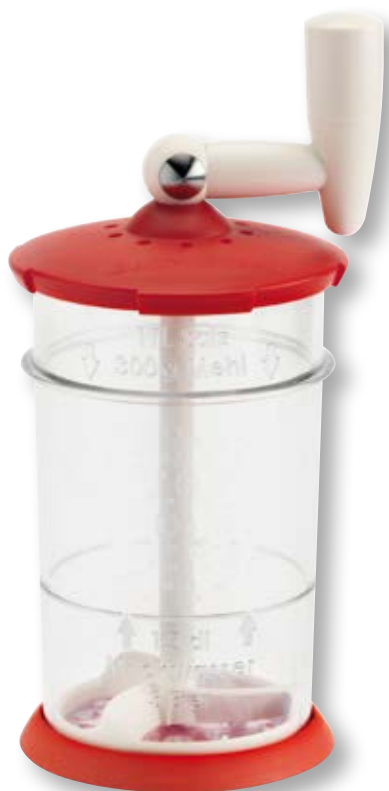
Spätzle Maker BBS 155004.01