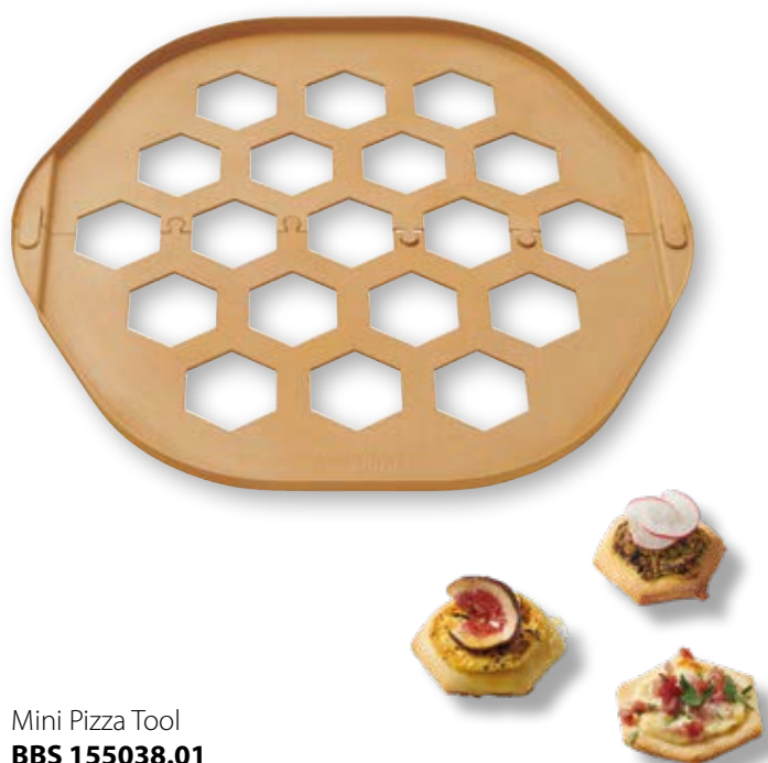
Mini Pizza Tool BBS 155038.01