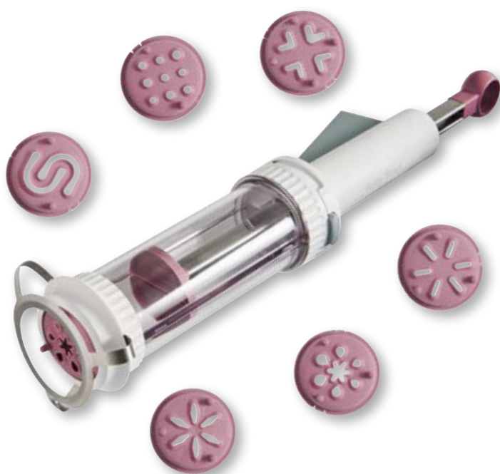
Cookie Press BBS 155037.01