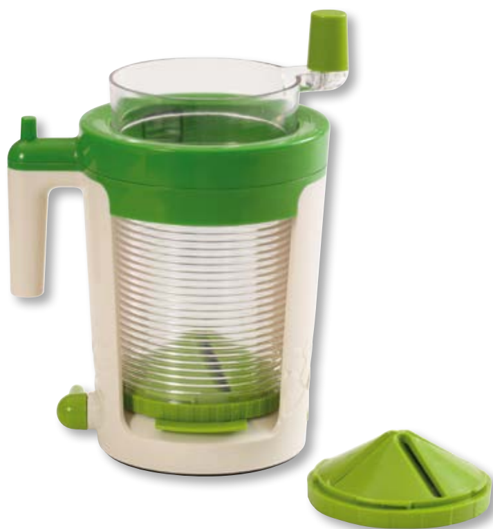
Maxi Spiralizer BBS 155001.01