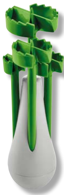
Veggie Drill BBS 155002.01