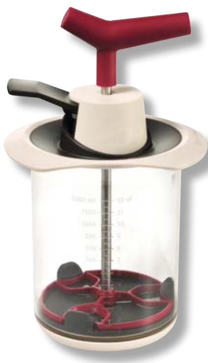
Batter Maker BBS 155007.01