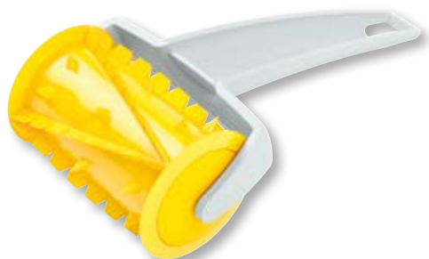
Nacho Roller BBS 155009.01