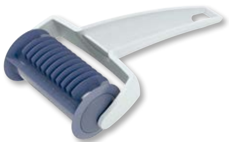
Stripes Roller BBS 155014.01