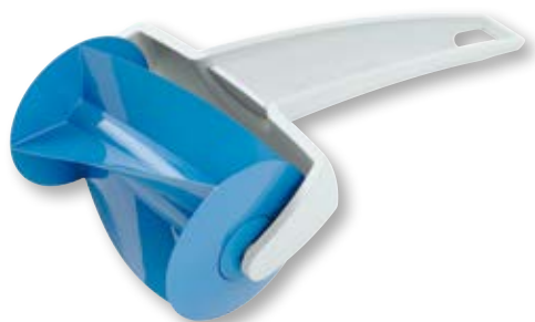
Pocket Roller BBS 155008.01