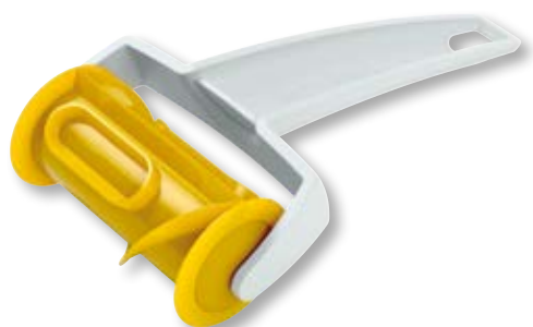
Croissant Roller BBS 155017.01