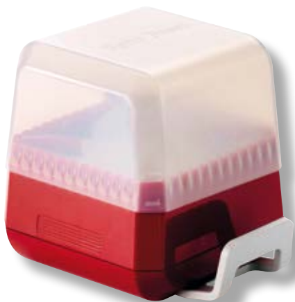
Wonderbox BBS 155006.01