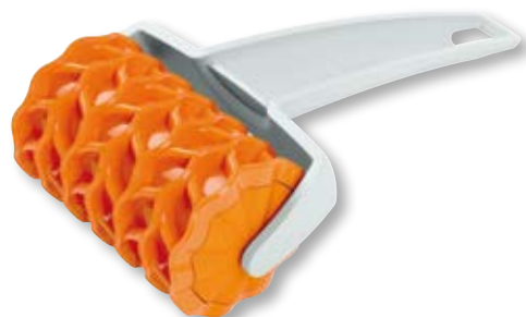
Grissini Roller BBS 155010.01