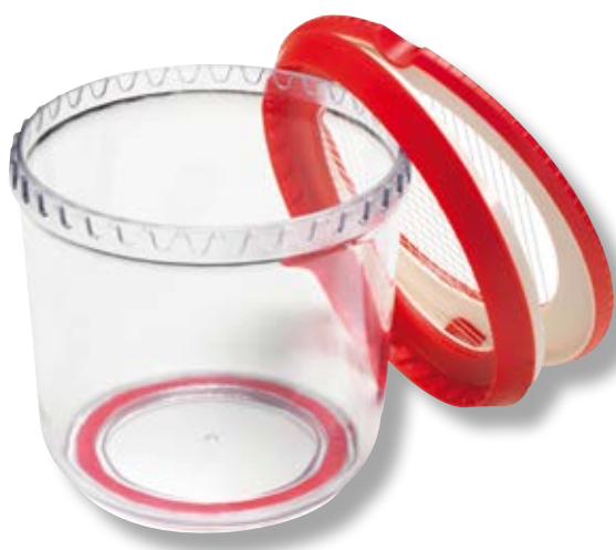
Hash Brown & Rösti Maker BBS 155005.01