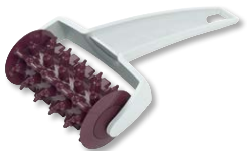
Cracker Roller BBS 155015.01