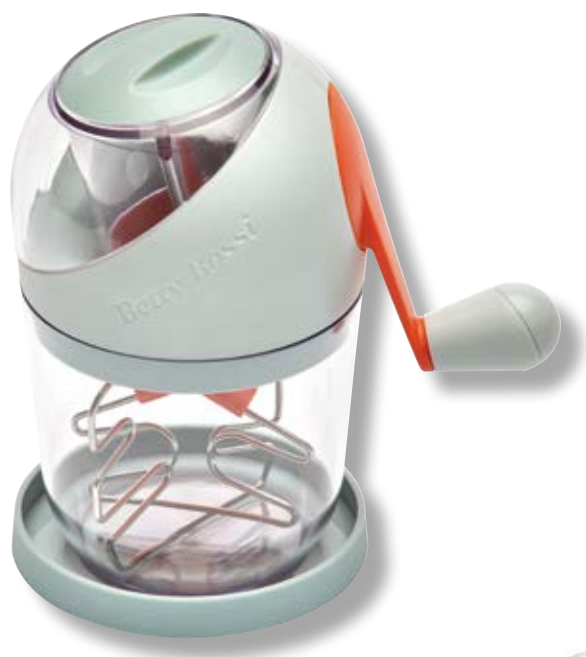
Sauce Maker BBS 155020.01