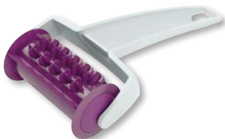
Star Roller BBS 155013.01