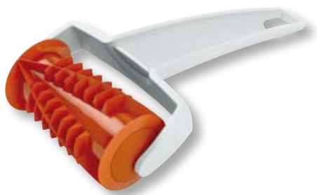
Christmas Roller BBS 155016.01