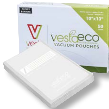
Confezione 50 sacchetti ECO VST 218102