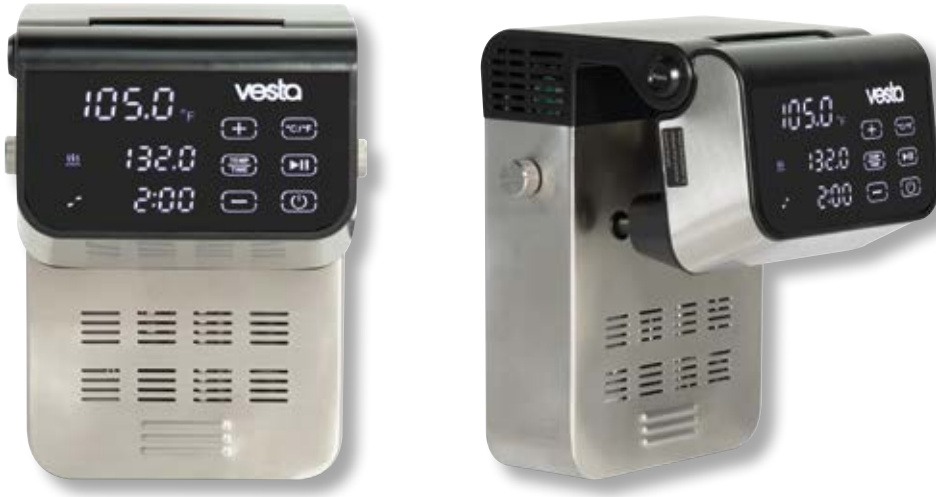
Roner ad immersione WiFi VST SV320