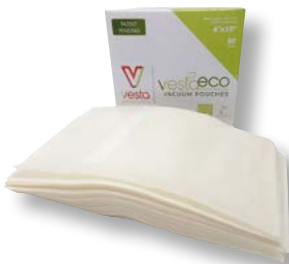
Confezione 50 sacchetti ECO VST 118103