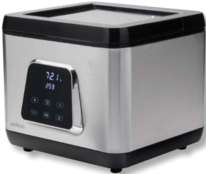
Vasca cottura sottovuoto - WiFi