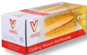
Confezione 25 sacchetti VST 109112