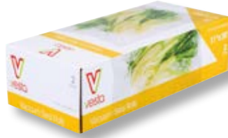
Confezione 2 rotoli VST 101212