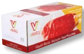
Confezione 25 sacchetti per liquidi VST 108111