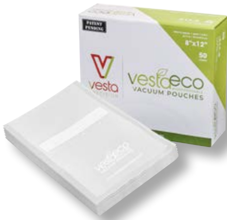
Confezione 50 sacchetti ECO VST 118101