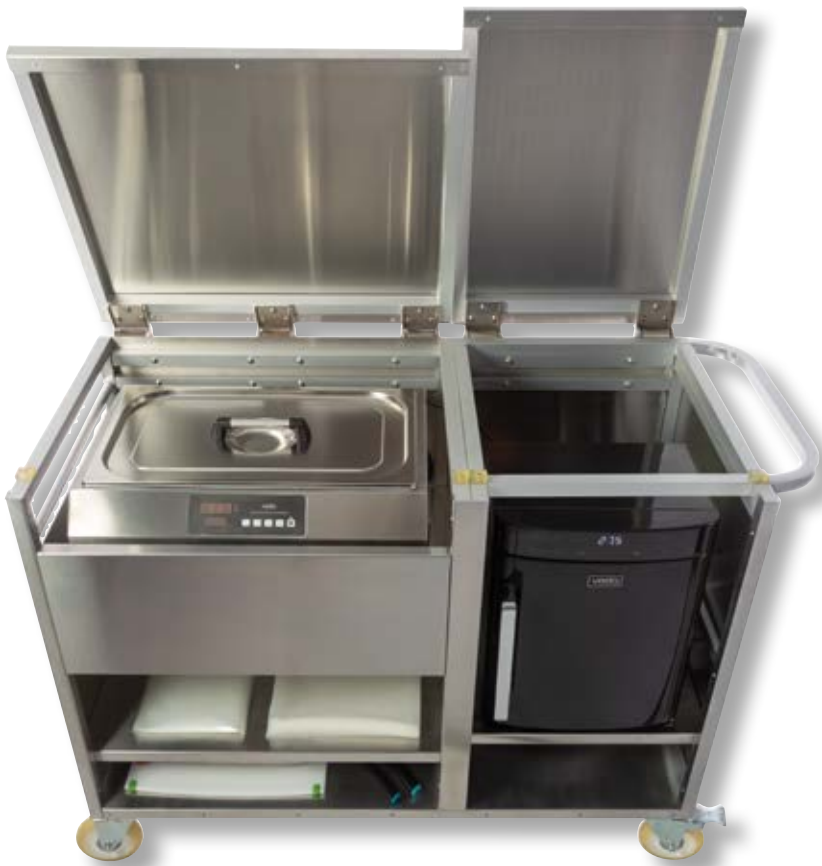
Stazione mobile sousvide