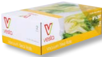
Confezione 2 rotoli VST 101211