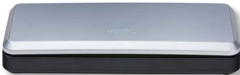
Barra per sottovuoto VST V06 SL