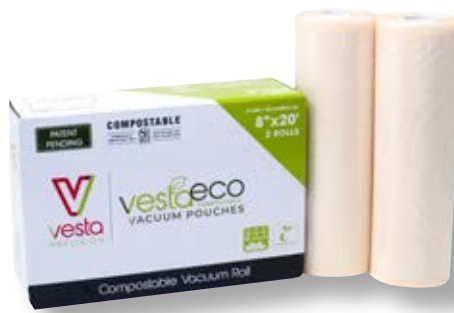
Confezione 2 rotoli ECO VTS 118202