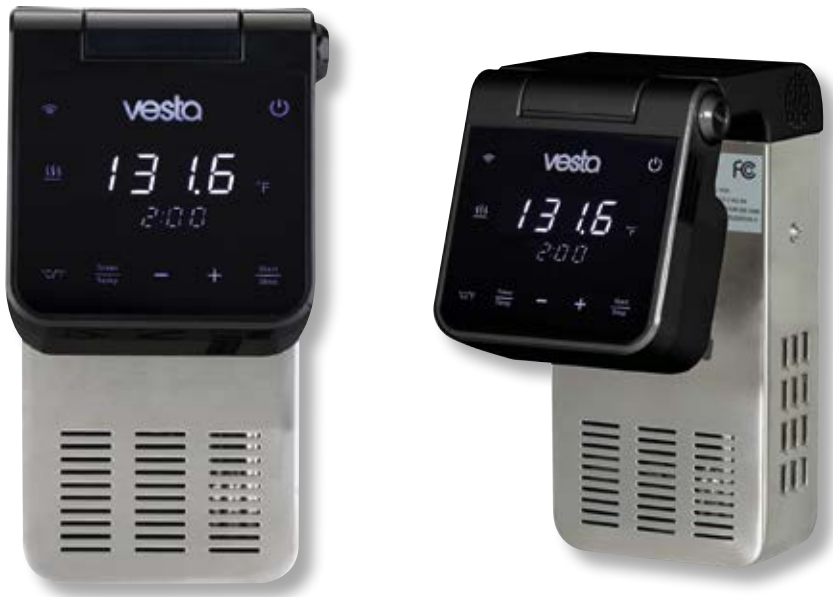
Roner ad immersione - WiFi VST SV81 BK