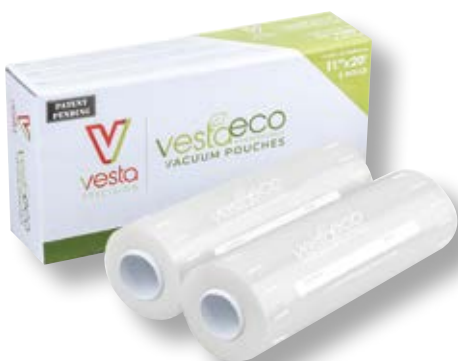
Confezione 2 rotoli ECO VTS 118201