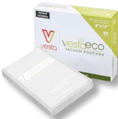
Confezione 50 sacchetti ECO VST 218101