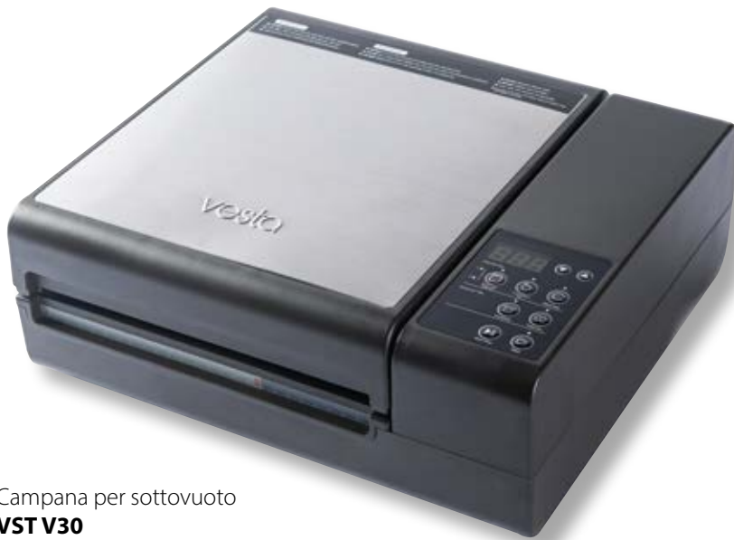
Campana per sottovuoto VST V30