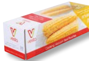
Confezione 25 sacchetti VST 109113