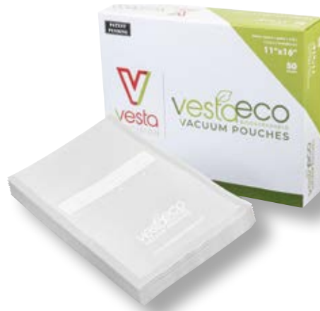
Confezione 50 sacchetti ECO VST 118102