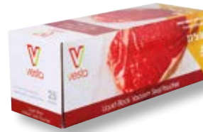
Confezione 25 sacchetti per liquidi VST 108112