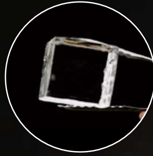
5,5 x 5,5 x 5,5 cm