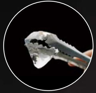
Ø 6 x 5,5 cm