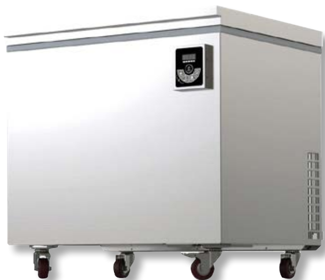
IMT310 TSP IMT310