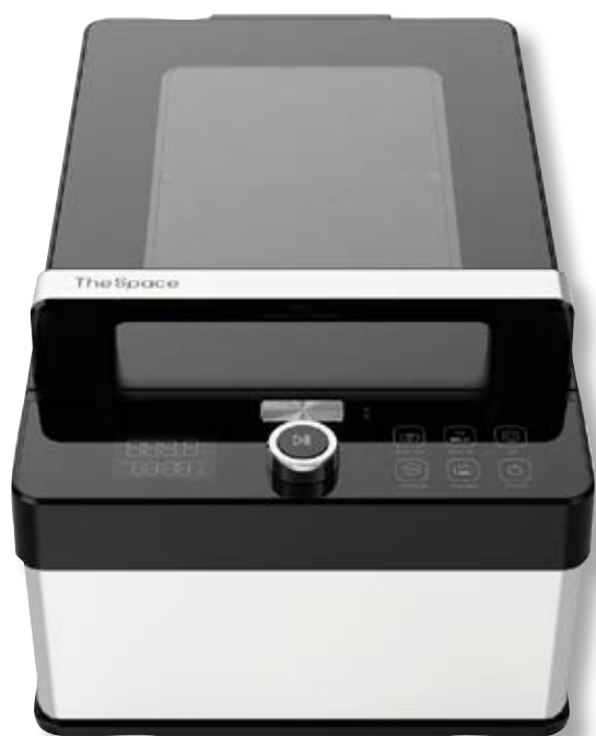
Neovide 500 TSP NSV500