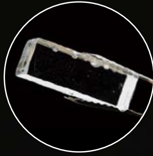
3,8 x 3,8 x 10,2 cm