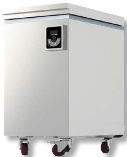
IMT210 TSP IMT210