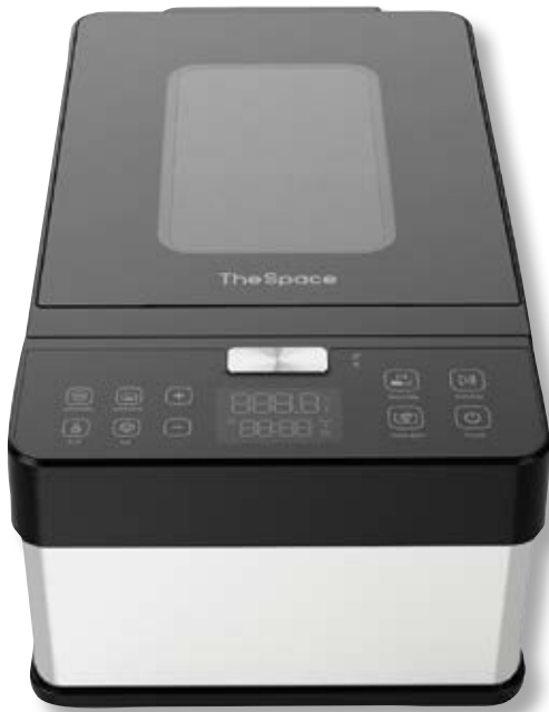
Neovide 100 TSP NSV100