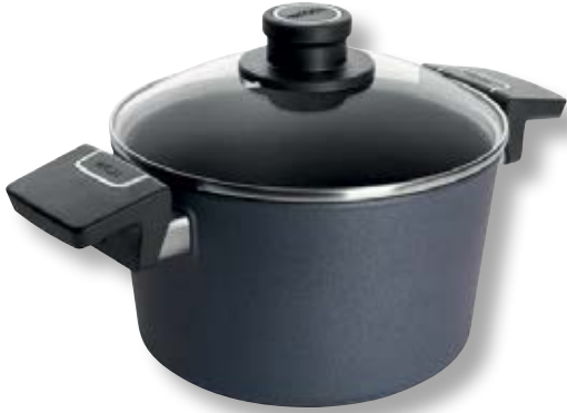
Diamond Lite Pentola con Coperchio WLL 120DPIL