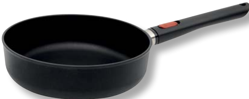
Eco Lite QXR Padella Alta