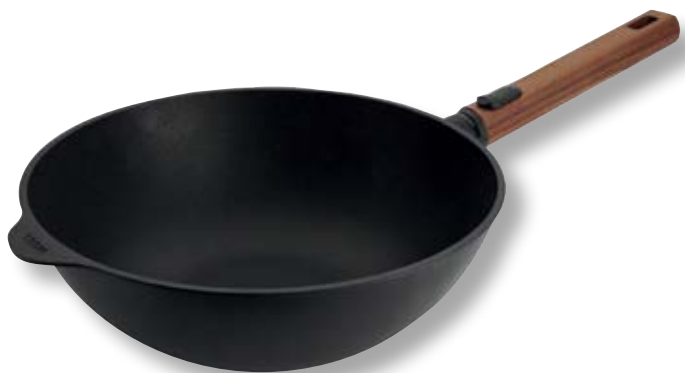
Eco Logic QXR Wok