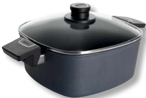
Diamond Lite Casseruola Quadrata con Coperchio