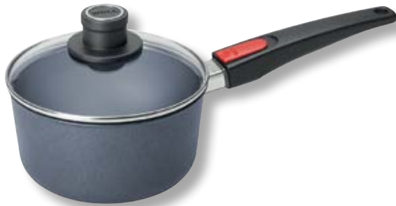
Diamond Lite Casseruola con Coperchio