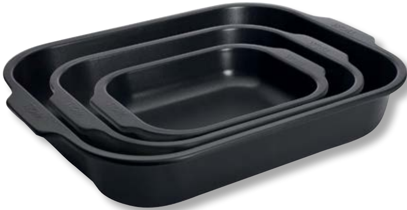
Set tre pirofile da forno WLL WB-SET004