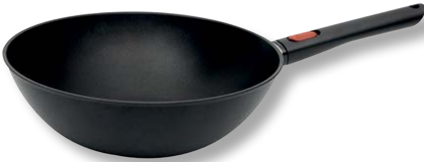
Eco Lite Wok