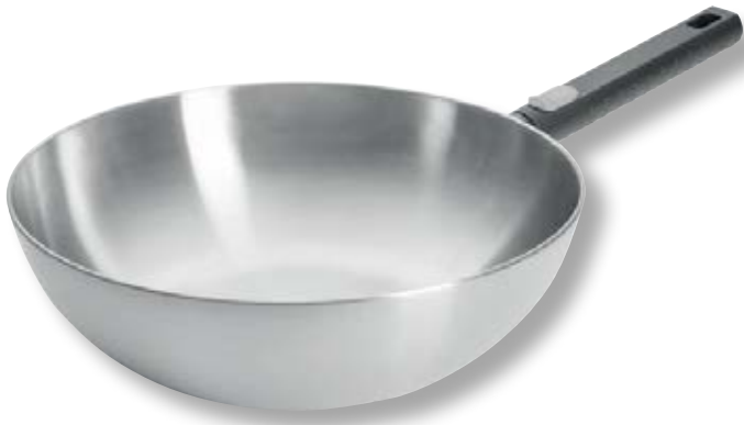
Logic Steel Wok WLL 11030LCS