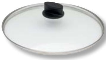
Coperchio Eco Lite