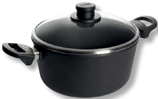
Titan Best Pentola con Coperchio