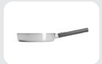
Logic Steel Padella Alta WLL 172 ..

Padella alta ultra resistente in alluminio e acciaio inox, adatta a tutti i tipi di cucine.