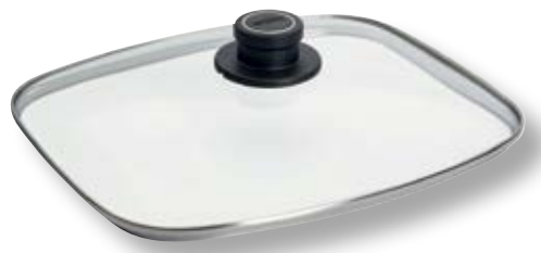
Coperchio Universale Rettangolare