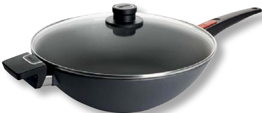
Diamond Lite Wok WLL 11034DPIL