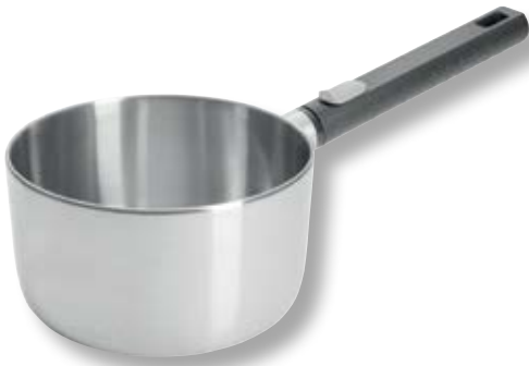
Logic Steel Casseruola