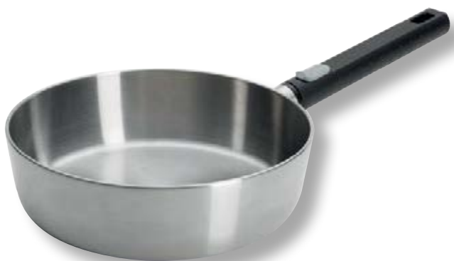
Logic Steel Padella Alta WLL 1724LCS