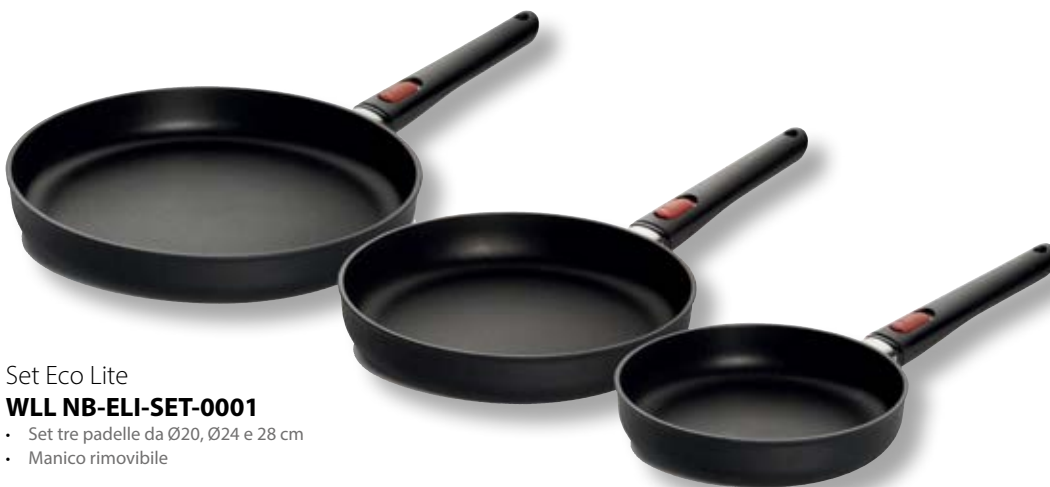
Set Eco Lite