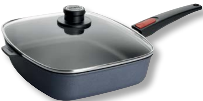
Diamond Lite Padella Rettangolare con Coperchio