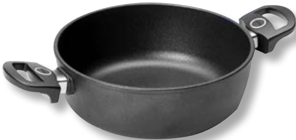
Titan Best Cassereuola Tonda WLL 824TBI