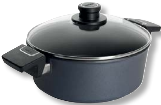
Diamond Lite Casseruola Tonda con Coperchio