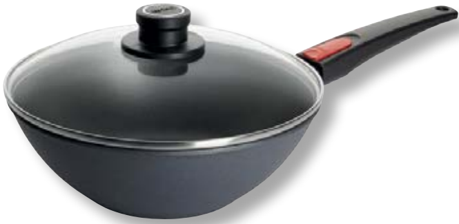
Diamond Lite Wok con Coperchio