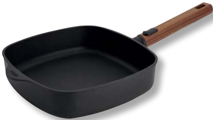
Eco Logic QXR Padella Quadrata Alta