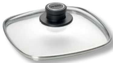
Coperchio Universale Quadrato