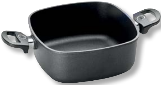
Titan Best Casseruola Quadrata