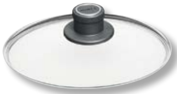
Coperchio Universale Tondo