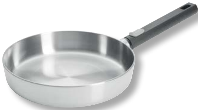
Logic Steel Padella Bassa WLL 1520LCS