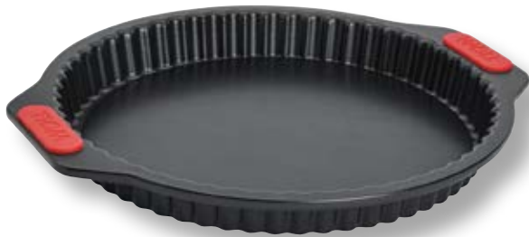
Stampo per quiche