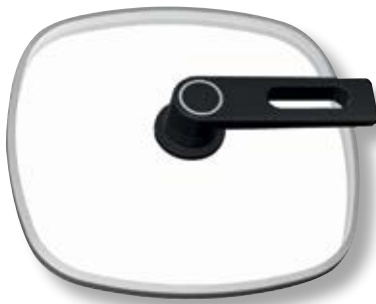
Coperchio Smart Quadrato