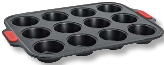
Teglia per muffin