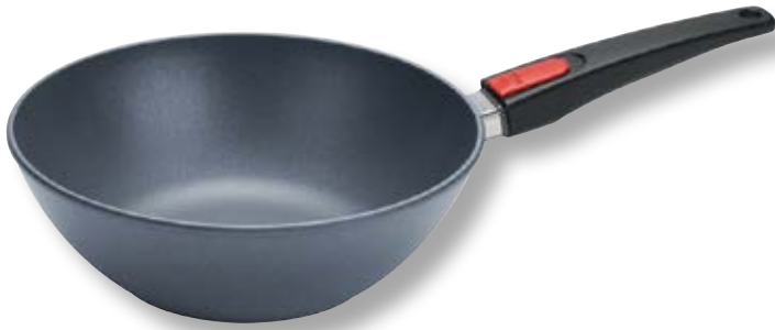
Diamond Lite Wok con Coperchio