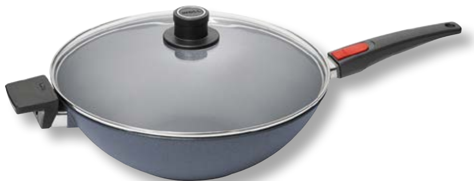
Diamond Lite Wok WLL 11034DPIL