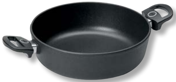
Titan Best Cassereuola Tonda