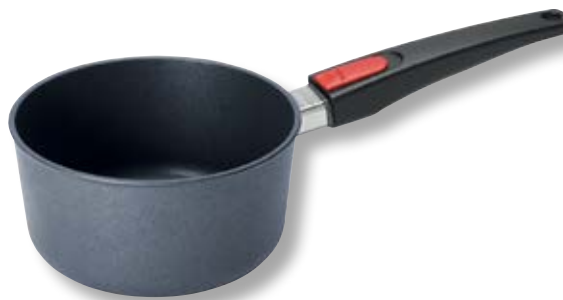
Diamond Lite Casseruola con Coperchio