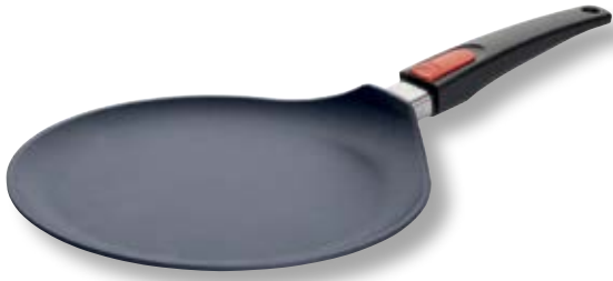
Diamond Lite Crepiera