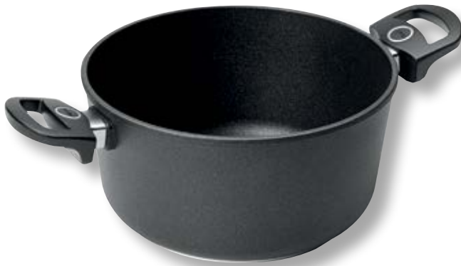
Titan Best Pentola