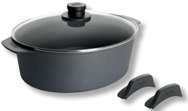
Diamond Lite Casseruola Alta con Coperchio