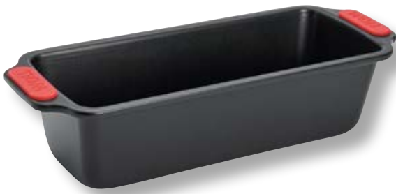
Stampo per pane WLL WB03