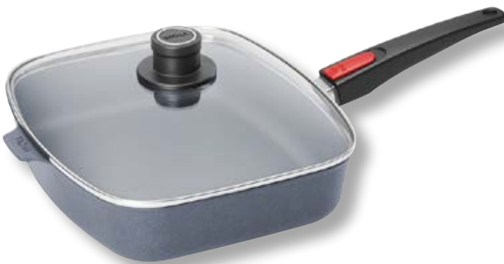
Diamond Lite Padella Rettangolare con Coperchio