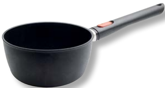
Eco Lite Casseruola