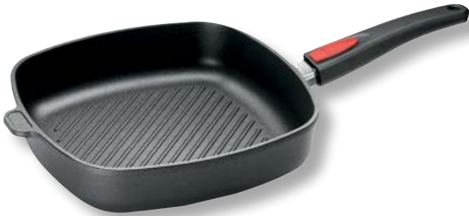
Titan Best bisteccaiera