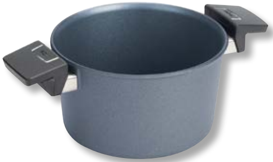
Diamond Lite Pentola con Coperchio WLL 120DPIL