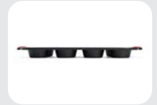
Stampo per quiche