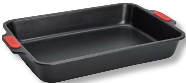
Stampo rettangolare WLL WB01