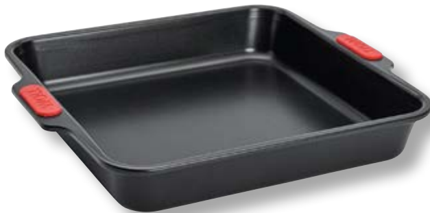
Stampo quadrato WLL WB09