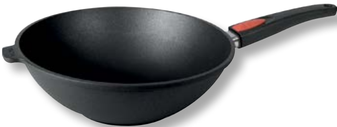
Titan Best wok