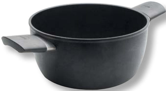
Eco Lite Pentola