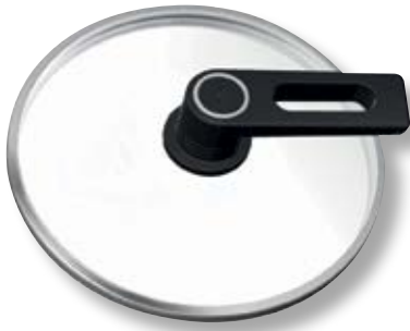
Coperchio Smart Tondo