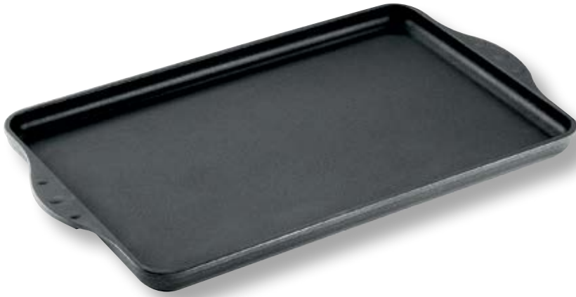
Titan Best Piastra Teppanyaki