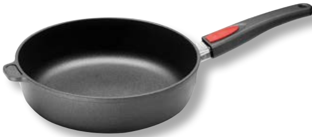
Titan Best Padella Alta