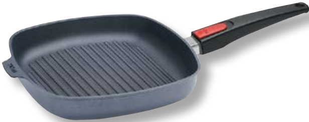
Diamond Lite Bistecchiera