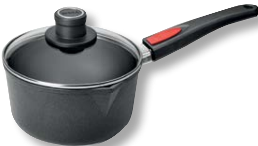
Titan Best Casseruola con Coperchio