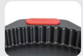
Stampo a cerniera