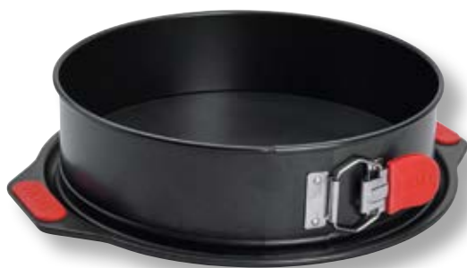
Stampo a cerniera