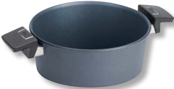
Diamond Lite Casseruola Tonda con Coperchio