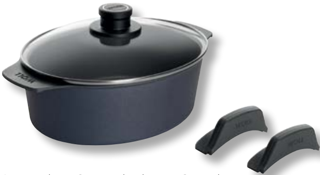
Diamond Lite Casseruola Alta con Coperchio