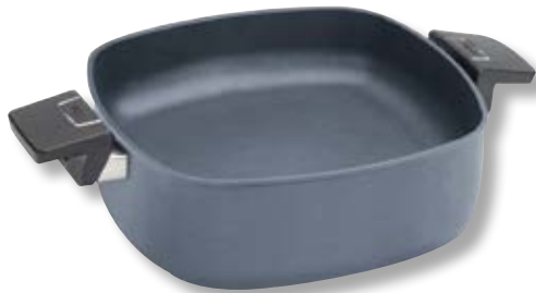
Diamond Lite Casseruola Quadrata con Coperchio