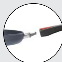
SEMPLICE E PRATICO