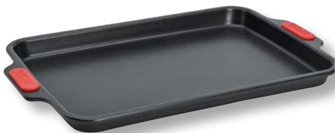
Teglia per biscotti WLL WB06