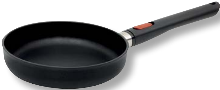
Eco Lite Padella Bassa