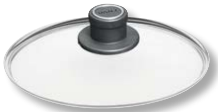
Coperchio Universale Tondo