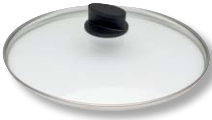
Coperchio Eco Lite