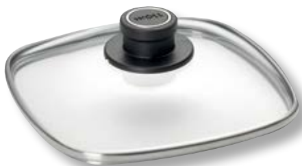
Coperchio Universale Quadrato