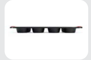
Stampo per quiche