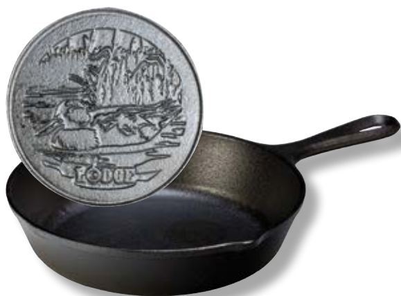
Padella Logo Anatra