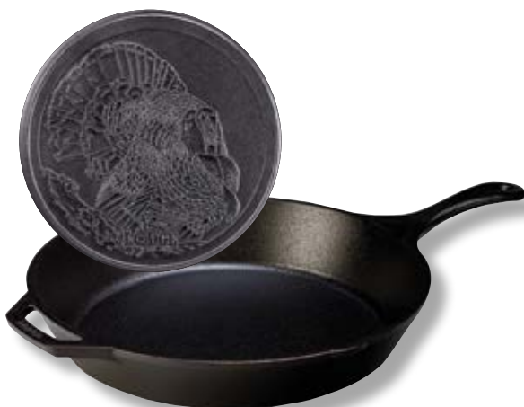
Padella alta Logo Tacchino