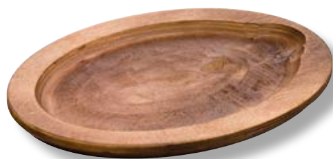
Vassoio ovale in legno