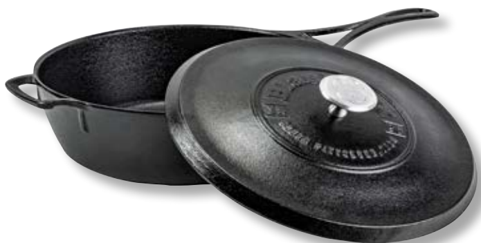
Tegame con coperchio Blacklock