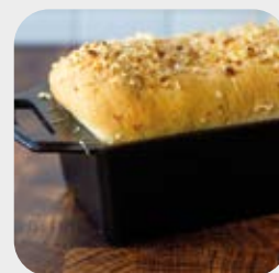
Teglia alta per pane