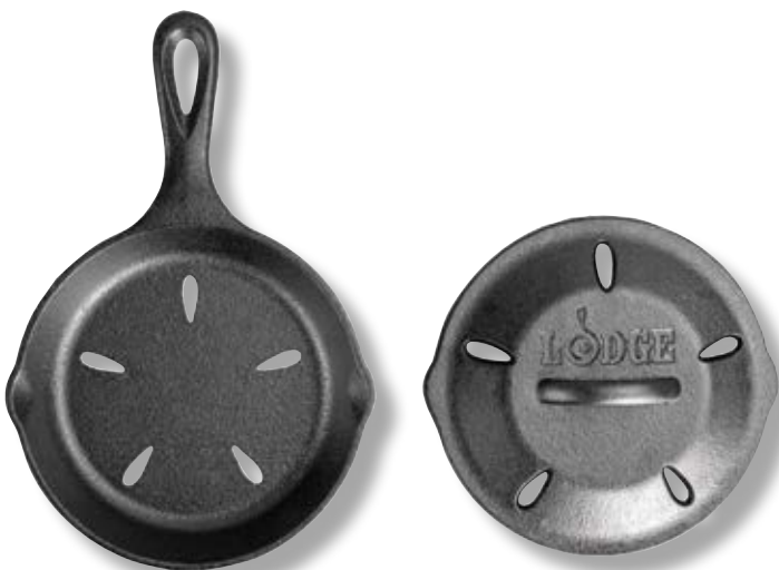
Padella per Affumicare con Coperchio