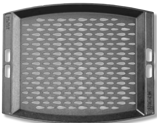
Piastra in ghisa forata