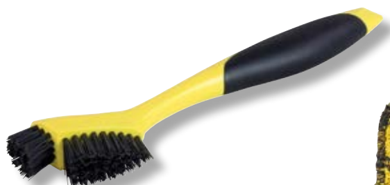
Spazzola per angoli