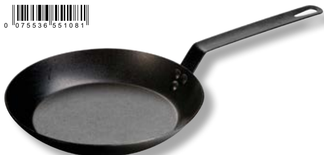
Padella in acciaio di carbonio