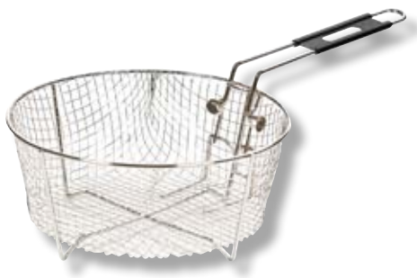
Cestello per friggere