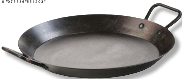
Padella doppio manico