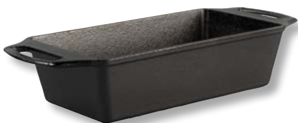
Teglia alta per pane