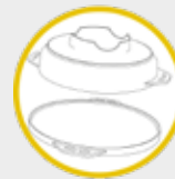
Forno per pizza