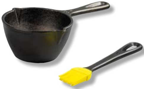
Casseruolina con pennello LDG LMPB21