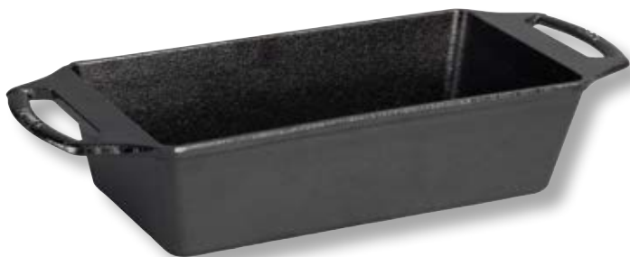
Teglia alta per pane