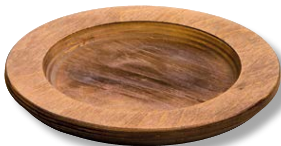
Vassoio tondo in legno