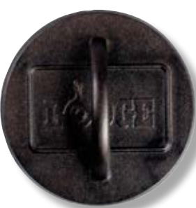
Pressa per grill tonda