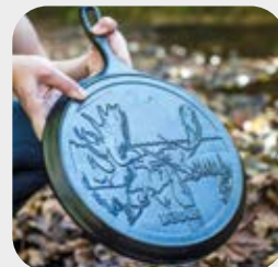
Padella alta Logo Orso