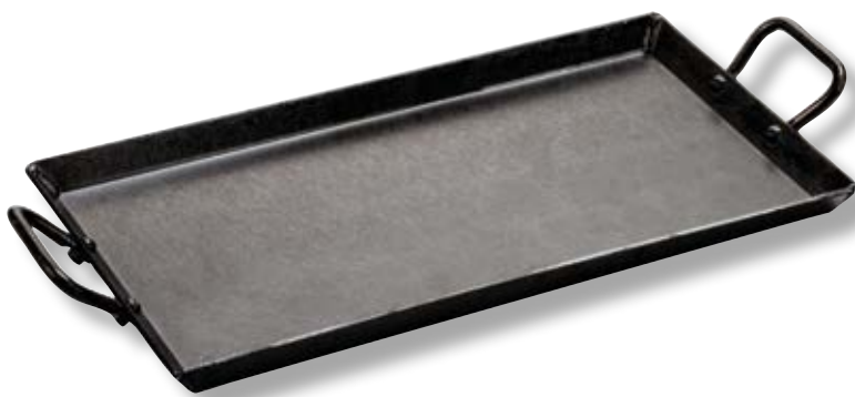
Piastra in acciaio di carbonio LDG CRSGR18