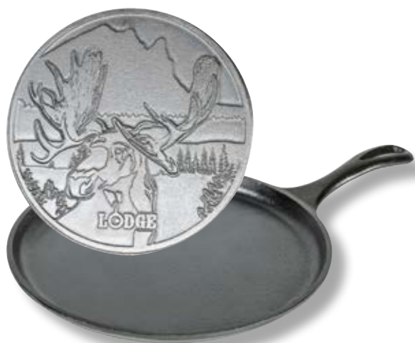
Bistecchiera Logo Alce