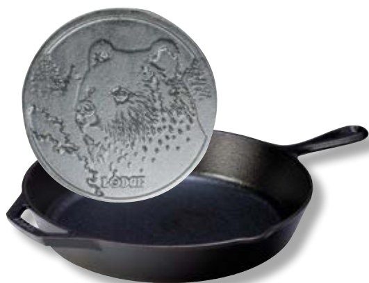
Padella alta Logo Orso