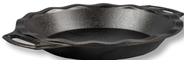
Teglia tonda per torte