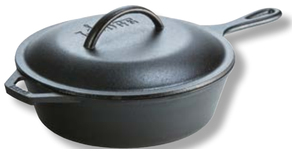
Pentola con coperchio