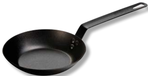
Padella in acciaio di carbonio