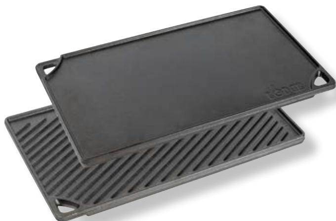
Piastra Griglia reversibile