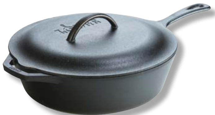
Pentola con coperchio