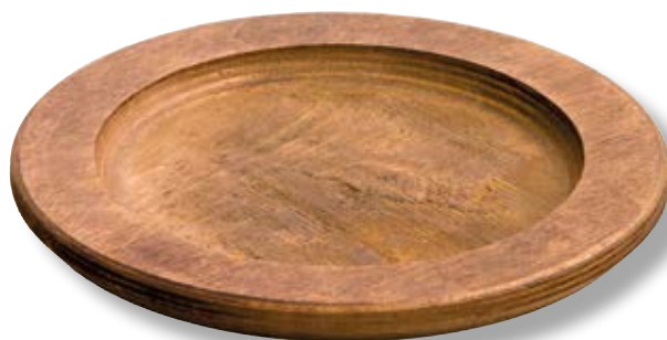
Vassoio tondo in legno