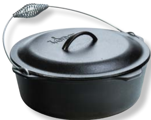
Forno Olandese con maniglia