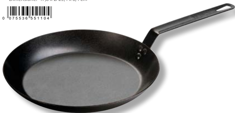
Padella in acciaio di carbonio