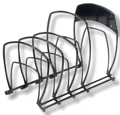
Sostegno da banco