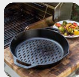
Piastra in ghisa forata