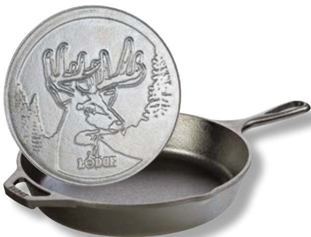
Padella Logo Cervo