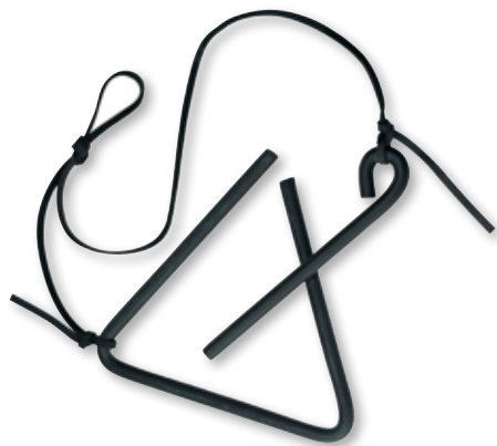
Campana per chiamata