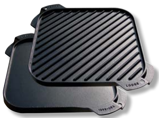
Piastra Griglia reversibile