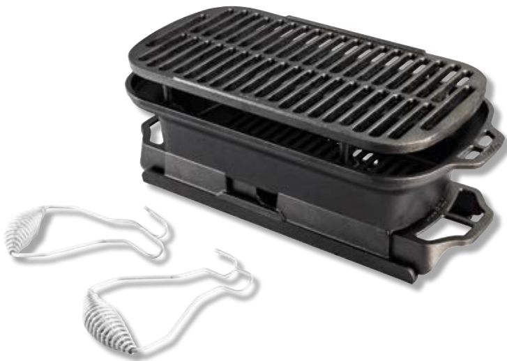
Griglia Sportsman Pro LDG LSPROGINT