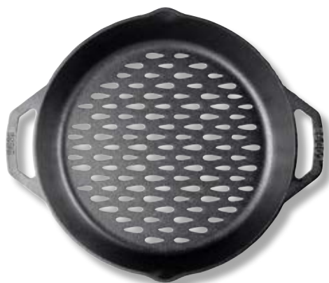
Pentola in ghisa forata