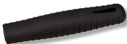
Manico in silicone