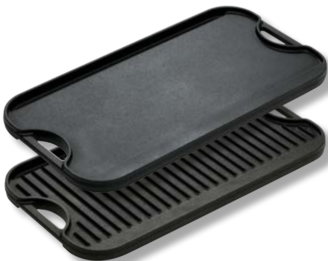
Piastra Griglia reversibile