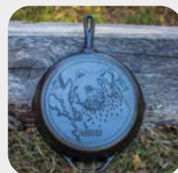
Padella alta Logo Tacchino