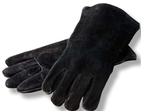
Guanti Pelle LDG A5-2