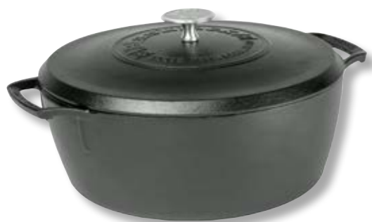
Casseruola con coperchio Blacklock

La linea Blacklock prende il nome dalla fonderia originale di Lodge Cast Iron. L'intera linea Blacklock è caratterizzata da una finitura triple seasoned™, pretrattata con tre strati di olio naturale per una finitura naturale e antiaderente pronta all'uso. Sapore eccezionale e pulizia semplificata. Le pentole Blacklock sono resistenti e adatte a qualsiasi piano cottura, forno, grill o fiamma libera. Nuovo design leggero in ghisa sottile progettato per sollevare, trasportare e maneggiare con facilità le pentole. Le maniglie e le contromaniglie sono state allungate e rialzate, in modo da rimanere lontane dal calore.