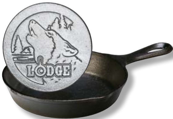
Padella Logo Lupo