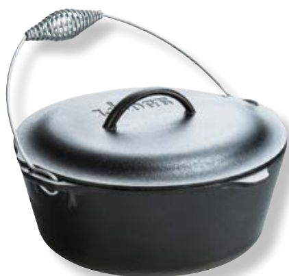
Forno Olandese con maniglia