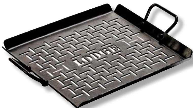
Piastra in acciaio di carbonio forata LDG CRSGP12