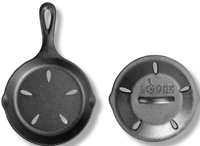
Padella per Affumicare con Coperchio