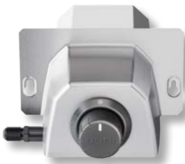
Bruciatore a gas forno Karu 12G