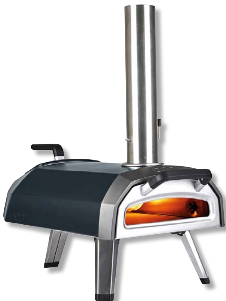
Ooni Karu 12G forno portatile a legna o carbone vegetale o gas