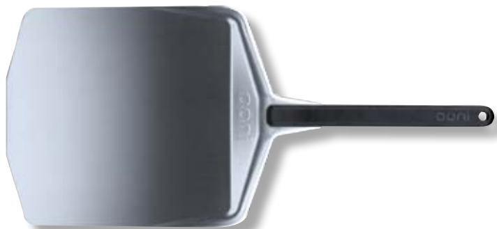
Pala in alluminio 30,5cm