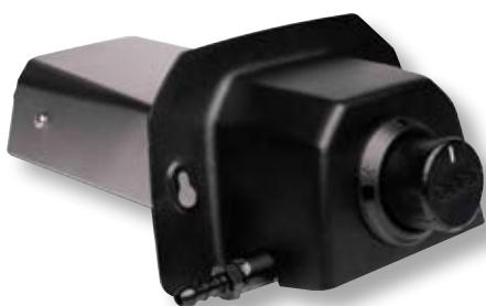
Bruciatore a gas forno Karu 16