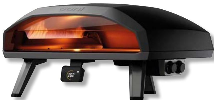
Forno a gas Koda 2 Max OON UU-P2B800