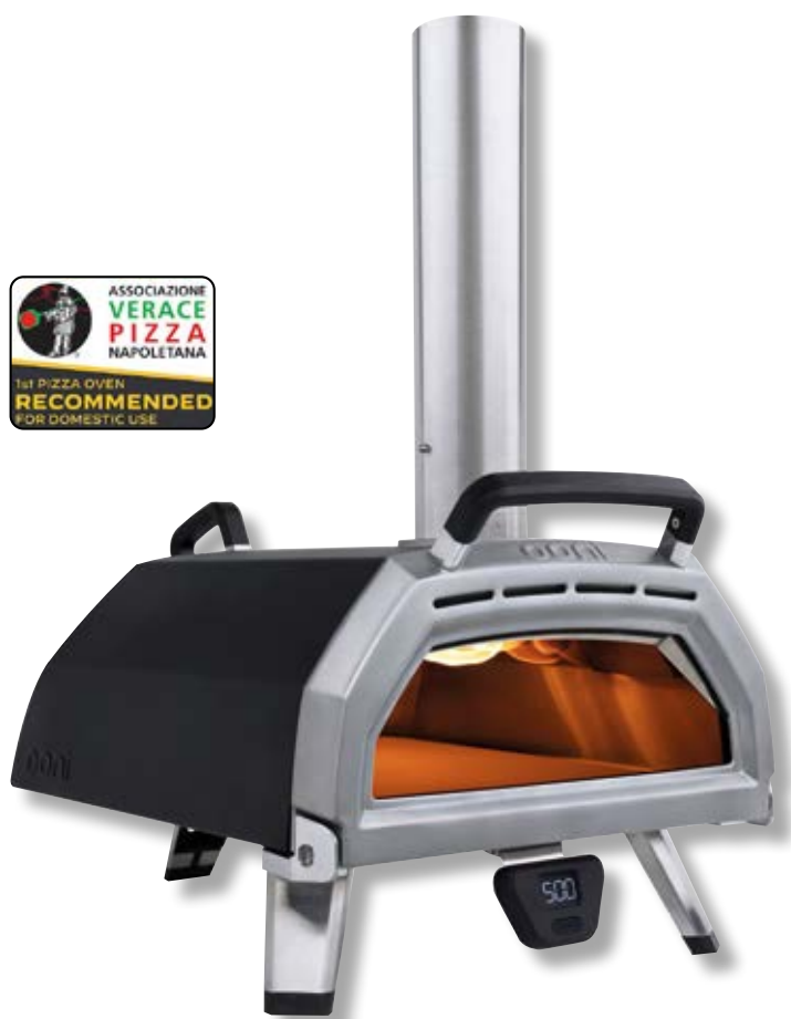
Ooni Karu 16 forno portatile a legna o carbone vegetale o gas