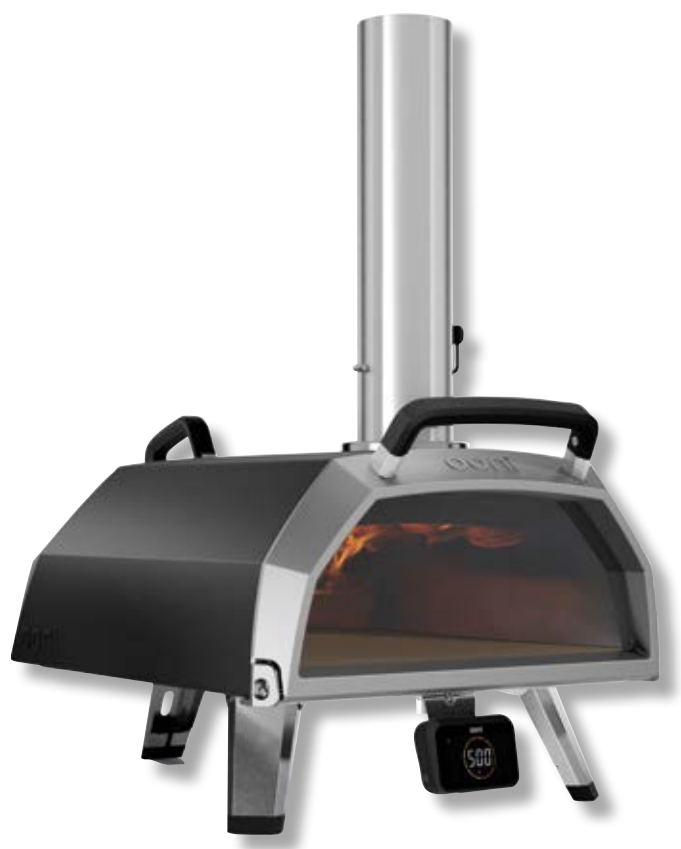
Ooni Karu 2 Pro forno portatile a legna o carbone vegetale o gas OON UU-P2EE00