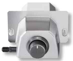
Bruciatore a gas forno Karu 12G OON UU-P0EB00