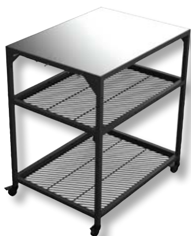
Tavolo modulare medium OON UU-P09700