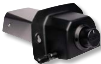
Bruciatore a gas forno Karu 2 Pro OON UU-P2EB00