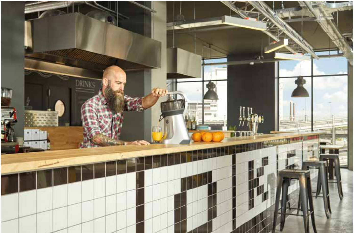
The Juicer wurde für den professionellen Einsatz entwickelt, passt aber auch perfekt in jede Küche zu Hause.