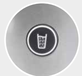
Beleuchtete Softtouch-Tasten zur Auswahl des gewünschten Saftmodus.