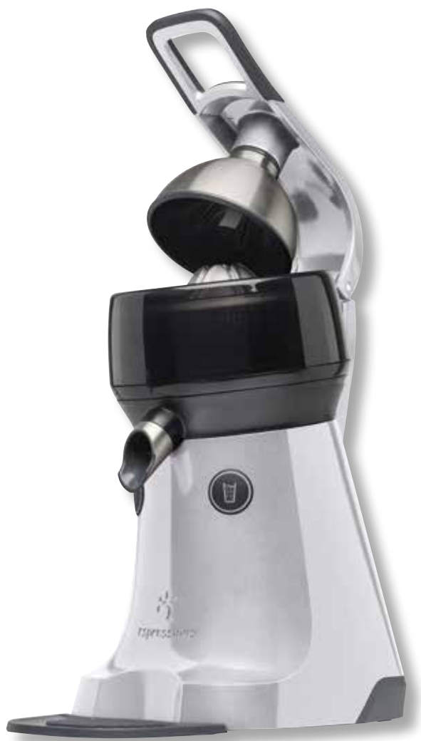
The Juicer ESP EP7000 SV