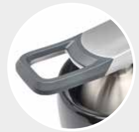
Ergonomischer Handgriff mit rutschfester Softgrip-Ausführung