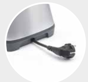
Praktisch integriertes Gehäuse für das Netzkabel.

Die neue Ikone des Entsaftens Ermöglicht müheloses und vollständiges Auspressen.