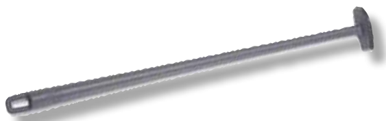
Under Blade Scraper VTX 064584