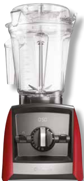
Ascent A2500i VTX A2500 RD • Farbe: Rot