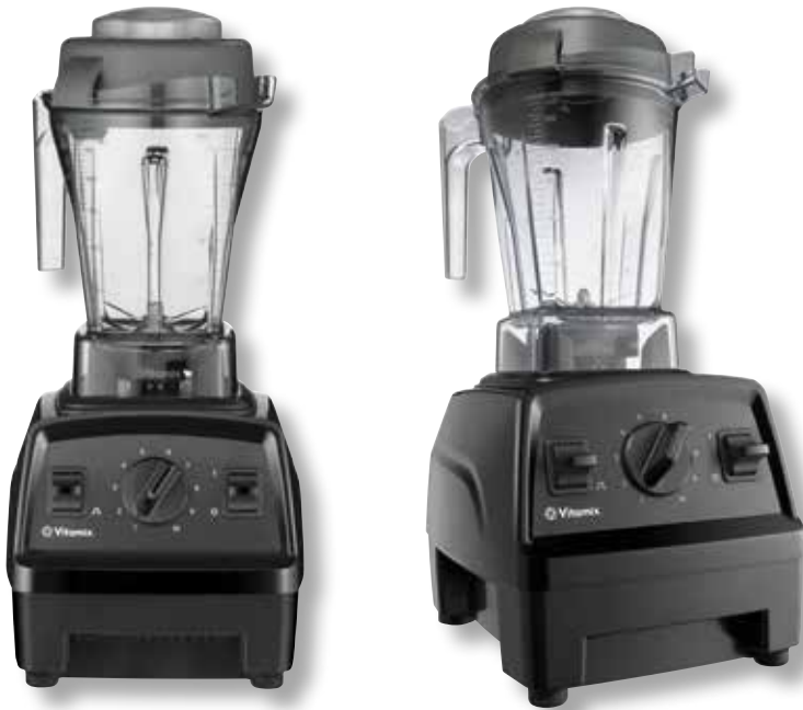
Vitamix Explorian E310 BK