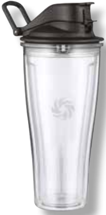
S30 Mix & Go Behälter VTX WET 60