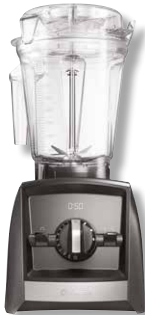
Ascent A2500i VTX A2500 GY • Farbe: Schiefergrau