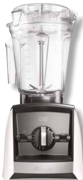
Ascent A2500i VTX A2500 WH • Farbe: Weiß