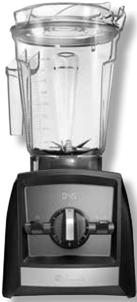
Vitamix Ascent A2300i