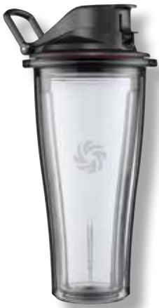
0,6 L Mix & Go Behälter