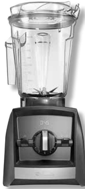
Vitamix Ascent A2300i