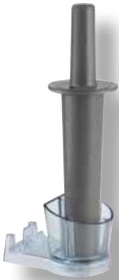
Tamper Holder Explorian VTX 065471