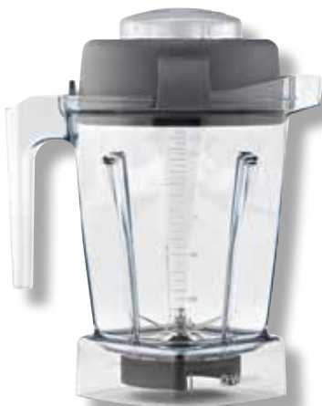
Behälter für Nasszubereitungen VTX WET 140