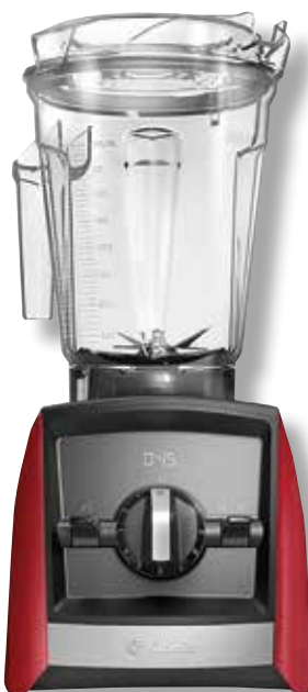
Vitamix Ascent A2300i