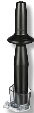
Tamper Holder Ascent VTX 064585