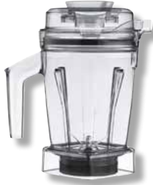
Interlock Ascent™ DRY-Behälter VTX 071194