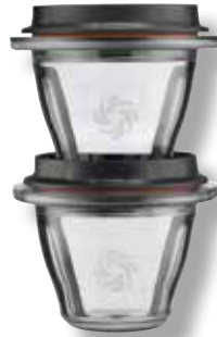
2 x 225 ml Behälter