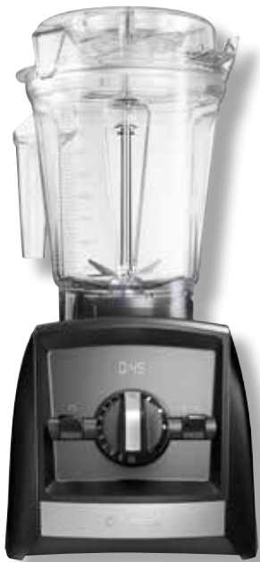
Ascent A2500i VTX A2500 BK • Farbe: Schwarz