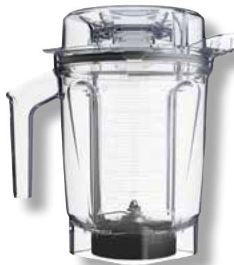
2.0 L TRITAN Niedrig-Behälter