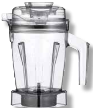
Interlock Ascent™ AER-Behälter VTX 071197