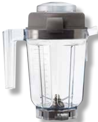
Behälter für Nasszubereitungen VTX WET 90