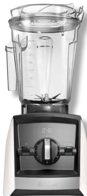
Vitamix Ascent A2300i