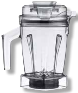
Interlock Ascent™ WET-Behälter VTX 071191