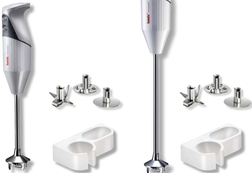
bamix® Gastro M 200 Bianco