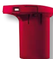
Batteria per Cordless