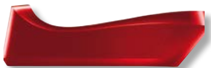
Caricatore per Cordless