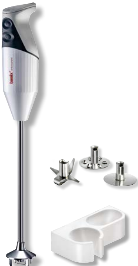
bamix® Gastro L 350 Bianco