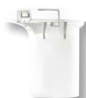
Batteria per Cordless