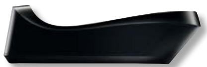
Caricatore per Cordless