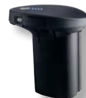
Batteria per Cordless