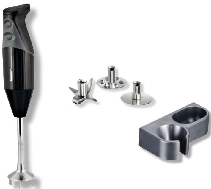
bamix® Gastro S 200 Nero