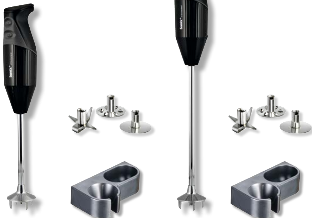
bamix® Gastro M 200 Nero