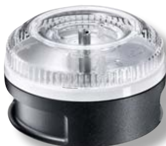
Processor BX 3001.001