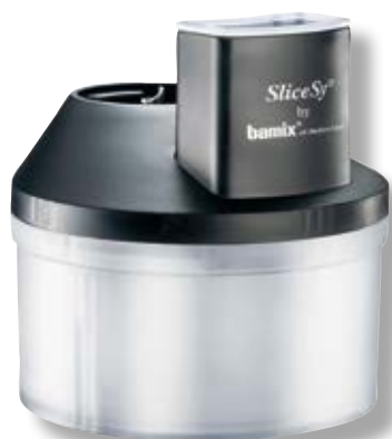
SliceSy® BX 1500.003