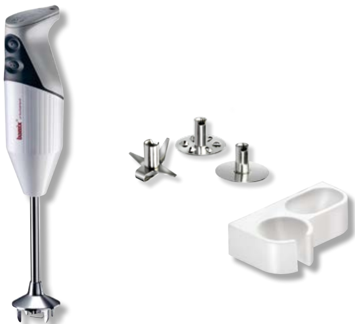
bamix® Gastro S 200 Bianco