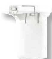
Batteria per Cordless