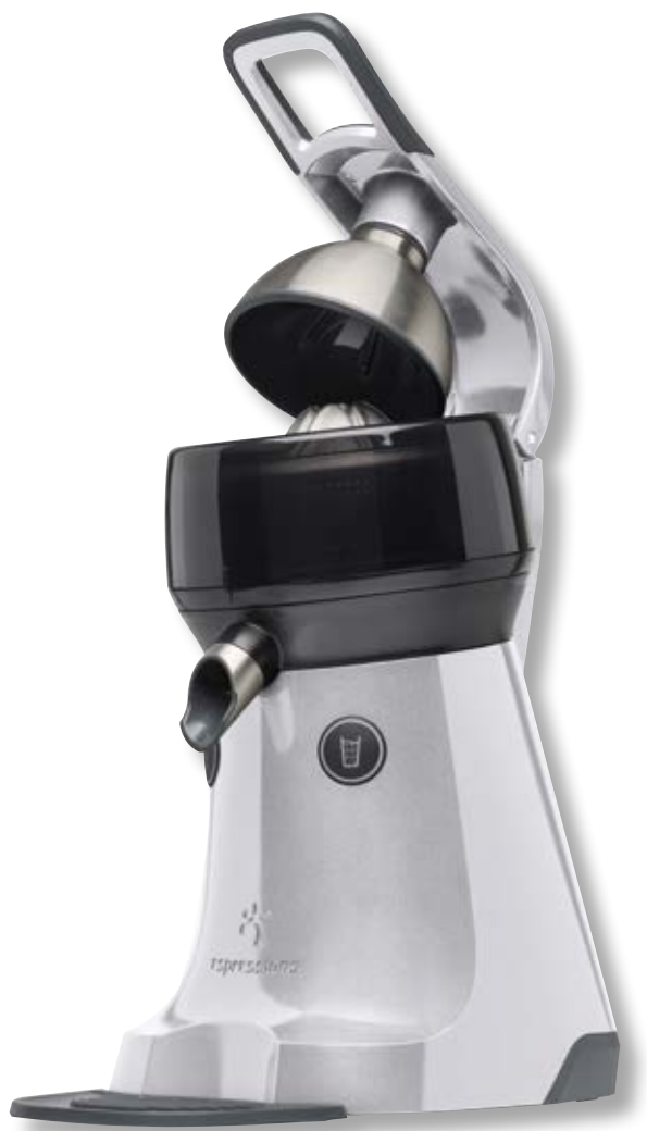
The Juicer ESP EP7000 SV