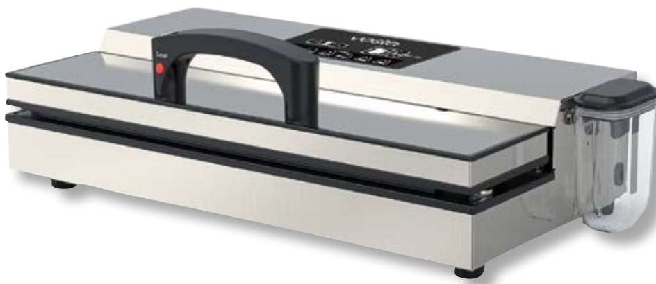
Barra saldante Pro II VST YJS780CFM