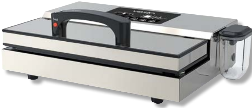
Barra saldante Pro I VST YJS604CFM