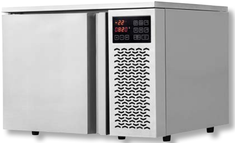
Abbattitore VST BF200 SS