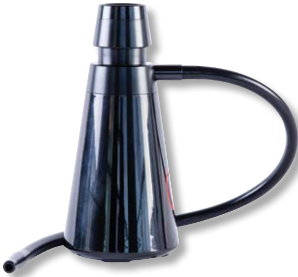
Affumicatore VST SG10 BK