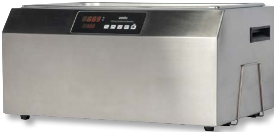
Vasca cottura sottovuoto VST SV251