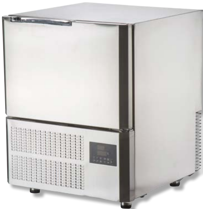
Abbattitore VST BF300 SS

Congelamento x 4 kg di alimenti: 240 min.