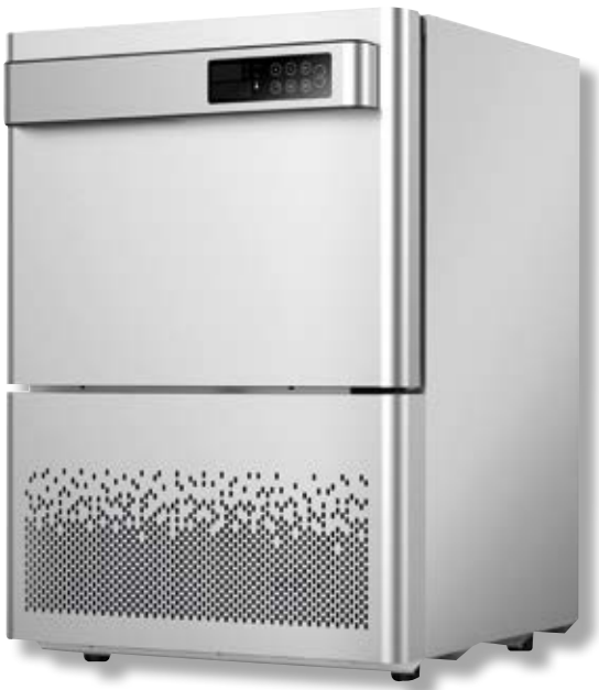
Abbattitore VST BF 100 SS