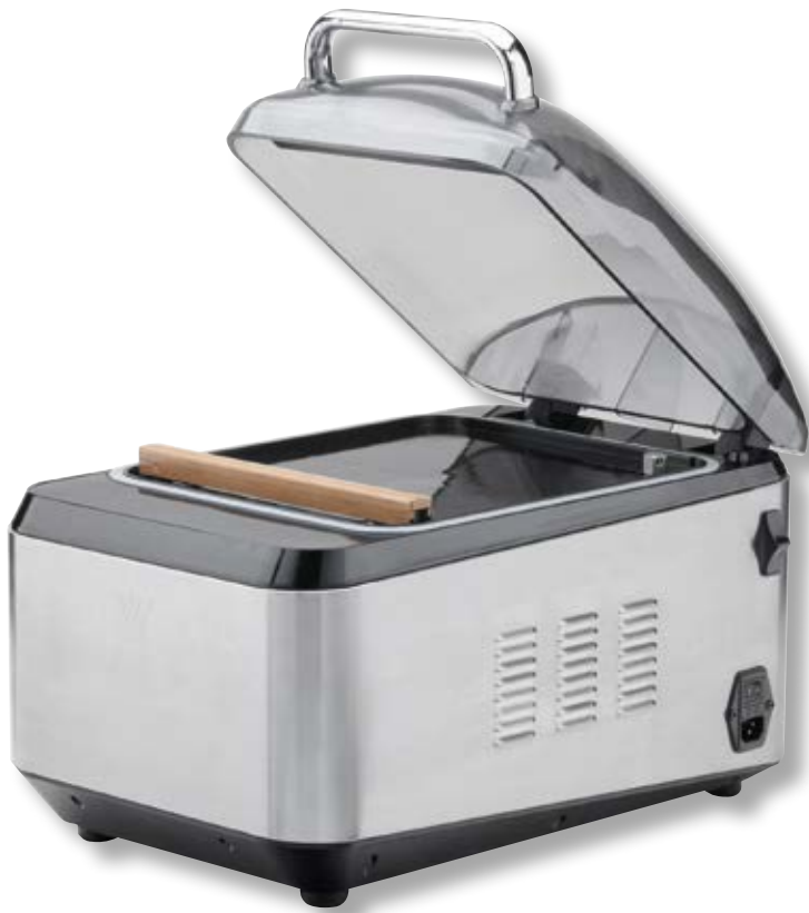
Campana per sottovuoto ad aria